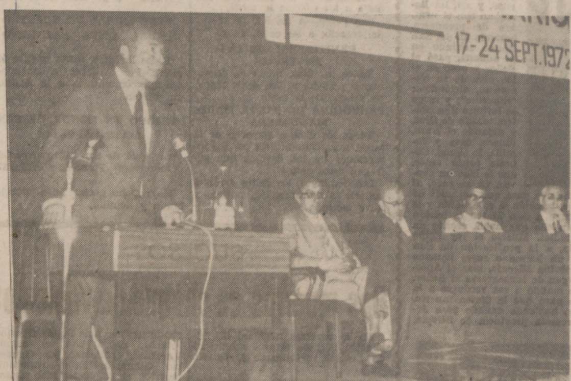
Los olímpicos vallisoletanos fueron recibidos por el director del certamen, con quien visitaron la galería dedicada al deporte, y después, en la parrilla del restaurante, asistieron a un coloquio, que resultó animadísimo. Finalmente fueron obsequiados con un vino español.