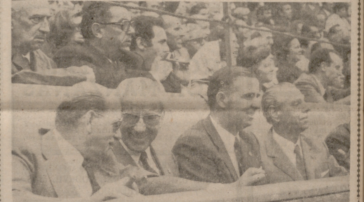
El Gobernador Civil y Jefe Provincial del Movimiento de Valladolid, acompañado por los gobernadores civiles de Segovia y Palencia...