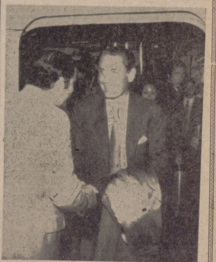
NUEVA YORK — El ministro español de Comercio, señor Fontana Codina, a su llegada a Nueva York, es recibido por el Consol de España en esta ciudad.