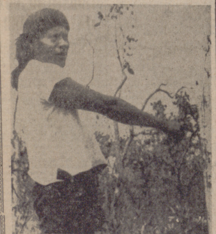
XAVANTINA (Brasil).—Con su revólver al cinto, este jefe indio de la tribu de Xavante señala la alambrada como una prueba de la invasión de su territorio por colonos blancos en la jungla del Mato Grosso, el Estado occidental que limita con Paraguay y Bolivia. El "Jornal do Brasil" informa que existe un abierto estado de guerra entre los indios y los colonos blancos.—(Telefoto Citra Gráfica-Upl.)