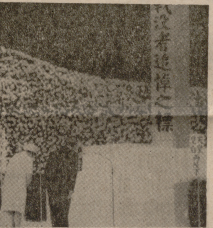
TOKIO.—El Emperador Hiro-Hito y la Emperatriz Nagako rinden silencioso tributo a los 3.100.000 muertos japoneses en la última guerra mundial, durante el servicio fúnebre celebrado ante el monumento a los caídos, al cumplirse el XXVII aniversario del fin de la contienda.