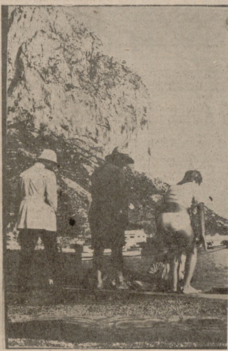
Turistas frente al Peñón de Ifach