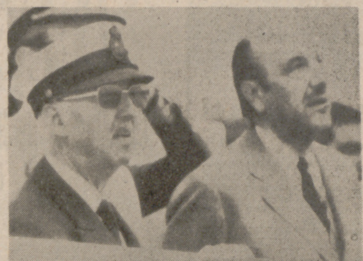
LA CORUNA.—Su Excelencia el Jefe del Estado ha presenciado ayer, desde la cubierta del yate "Azor", una exhibición de paracaidismo. Acompañaba al Jefe del Estado, entre otras personalidades, el Ministro del Ejército.