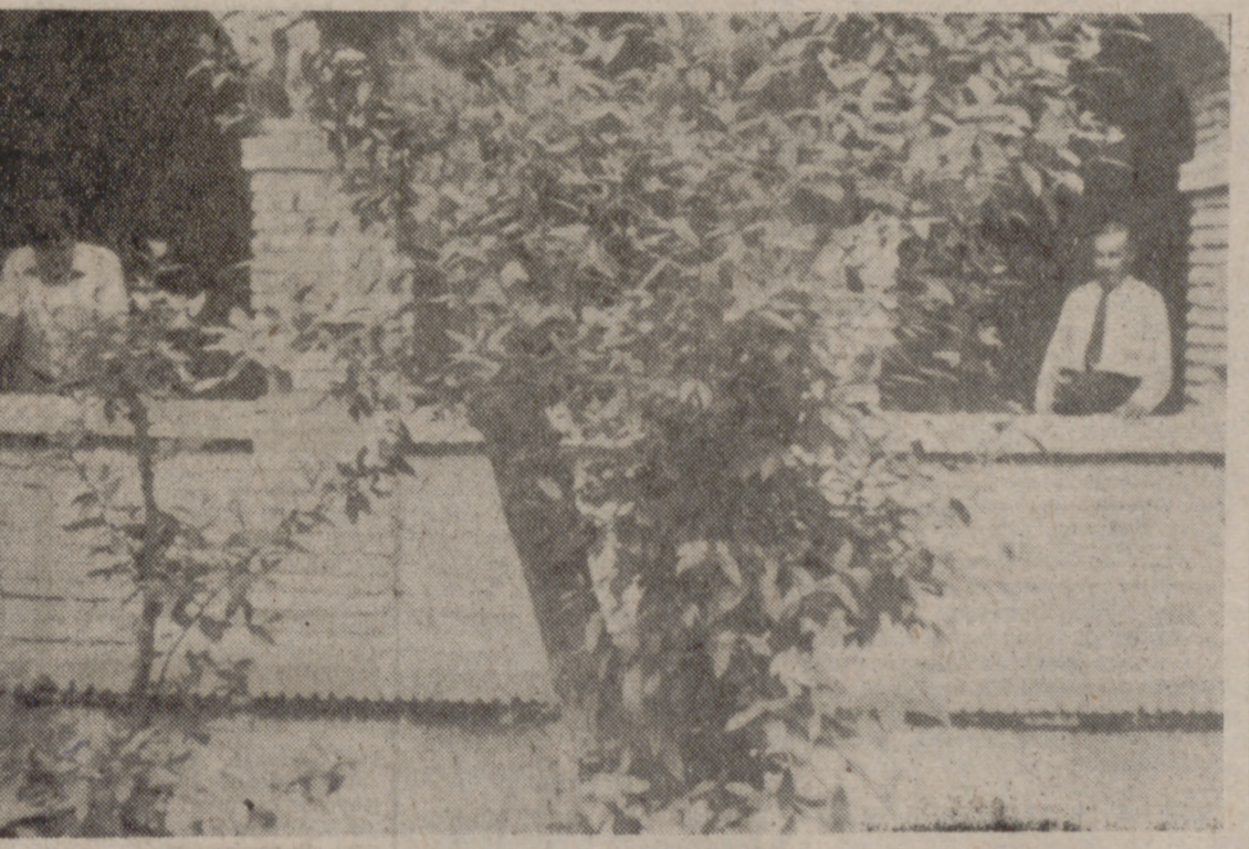
Galería del claustro, con el famoso laurel.

O, como en Almagro, paradores de turismo