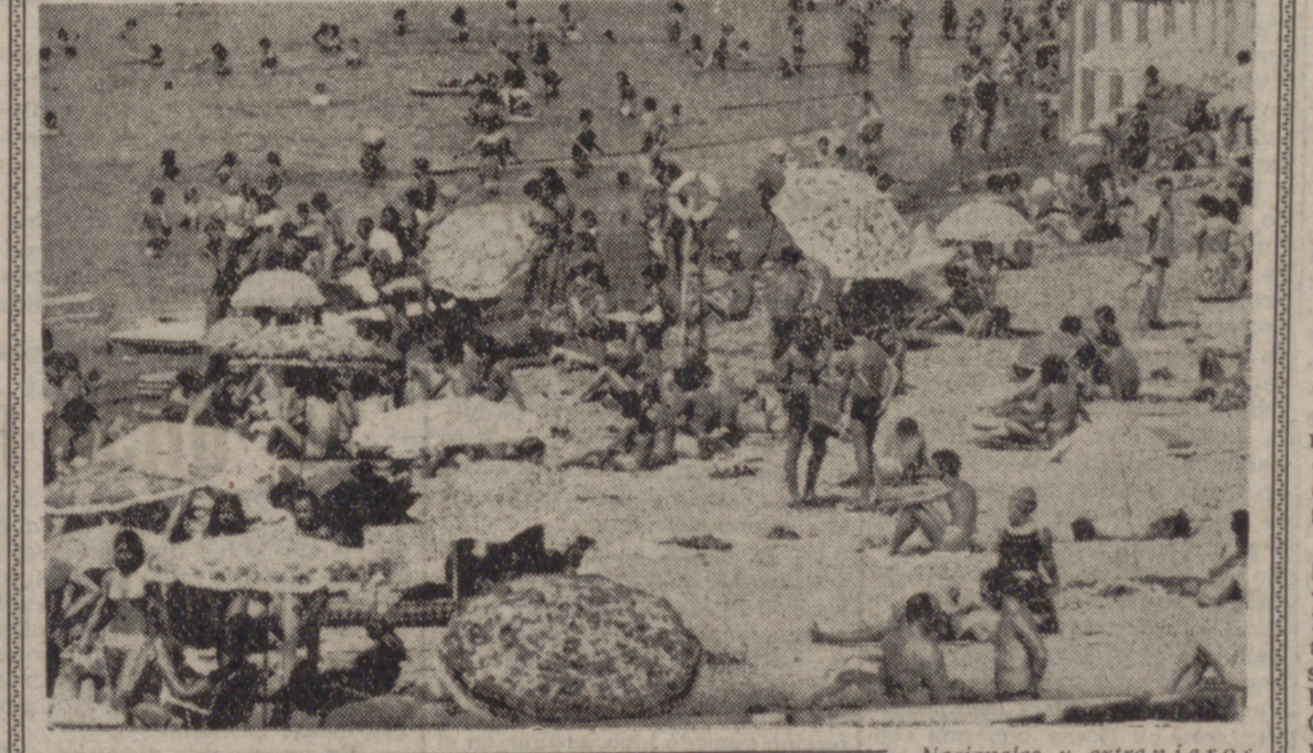
Nacionales y extranjeros abarrotan estos días las numerosas playas del dilatado litoral español. Desde Pontevedra a San Sebastián, y desde Gerona a Huelva, en el Cantábrico, Mediterráneo y Atlántico, respectivamente, las playas estos días constituyen un auténtico hormiguero humano. Una prueba elocuente la da la presente instantánea. En la fotografía, una vista de una de las playas del litoral malgüeño, donde turistas y nativos refrescan y tuestan su piel alternativamente.