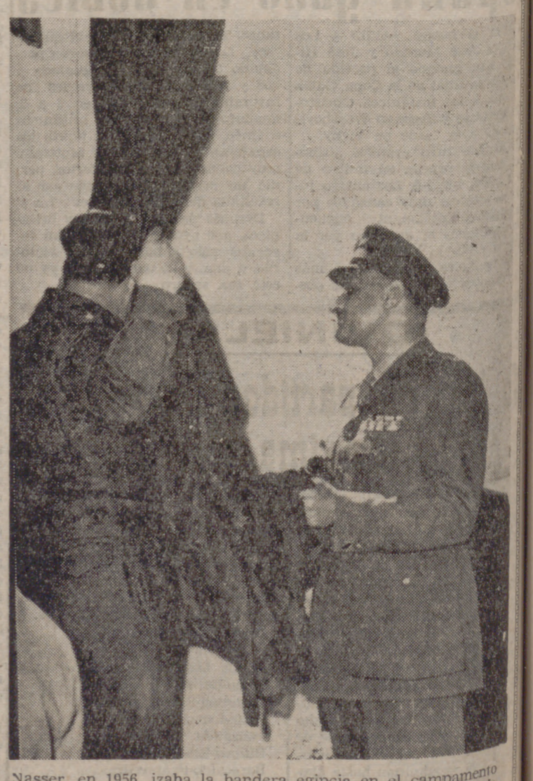
Nasser, en 1956, izaba la bandera egipcia en el campamento de Shalufa, primera de las bases del Ejército británico en la zona de Suez. Dieciséis años después de su mayor victoria, su recuerdo comienza a pasar al olvido.

En la mezquita de Al-Fateh, a la que ya no llegan delega-