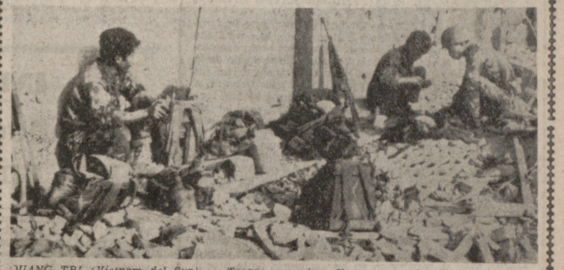
QUANG TRI (Vietnam del Sur). — Tropas aéreas transportadas vietnamitas se refugian junto a un muro destruido por los impactos de las balas durante una larga batalla para recuperar la ciudad, por las tropas sobrevivientes. Un reportero ha dicho que las tropas del Gobierno habían conseguido atravesar el río al oeste de la ciudad.