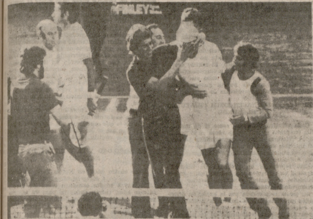
BARCELONA.—Semifinales Interzonas de Copa Davis: España, 2; Estados Unidos, 3. Estados Unidos ha eliminado a España por tres victorias a dos, y disputará la final de la Copa Davis con Rumania...