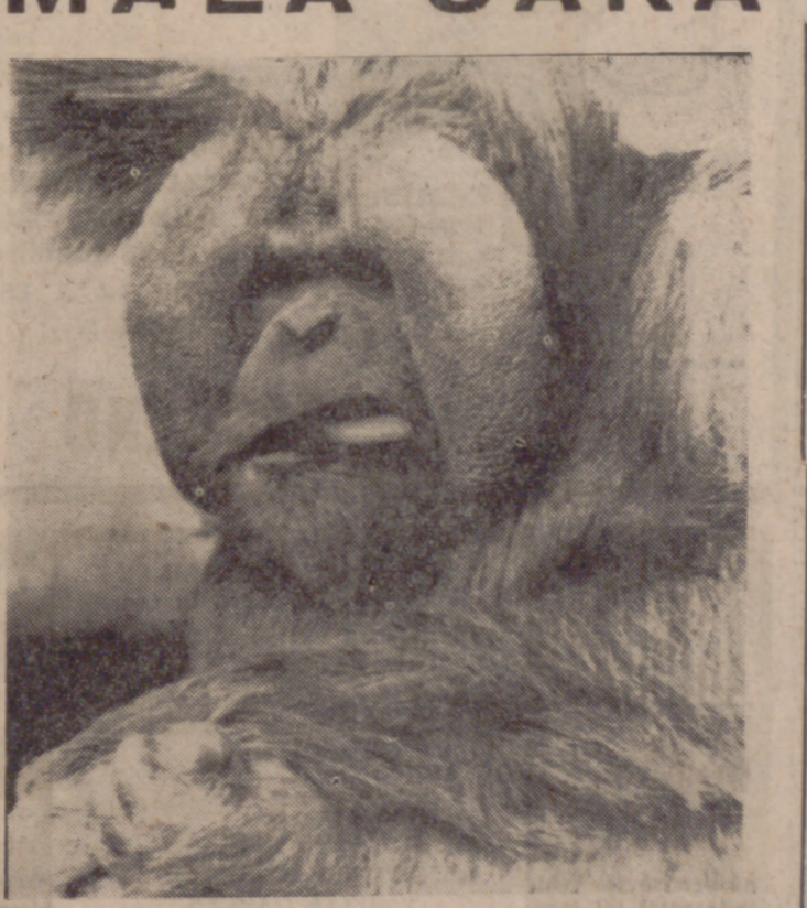
SACRAMENTO (California). — Cuando «Baldy», el orangután residente del zoológico local, tiene que posar para los fotógrafos, éstos nunca saben si les va a sonreír o no. En esta foto, «Baldy» no parecía muy dispuesto a hacerlo.