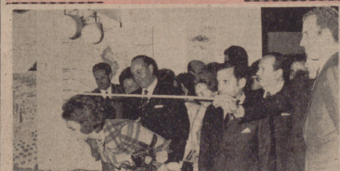
TORREMOLINOS (Málaga).—En el Palacio de Congresos y Exposiciones, y con motivo de presidir la inauguración de la Exposición "70 Málaga 80", los Príncipes de España, acompañados de las autoridades, visitan las instalaciones de la misma.

La visita a la primera ciudad les impresionó profundamente