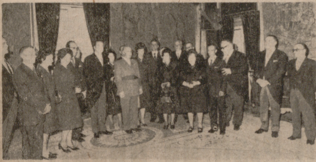
MADRID.—Un momento de la entrega por el Jefe del Estado de los Premios Nacionales y Provinciales de Natalidad y Promoción Familiar a los beneficiarios de los mismos, acompañados del Ministro de Trabajo.