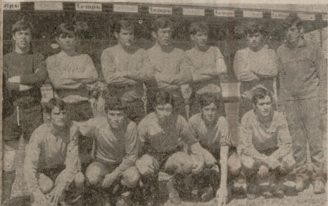
El Béjar ha dado un importante paso en sus aspiraciones al derrotar al Europa Delicias.

C. D. Iscar: Alvarez, Pereda, Coica, Medina; Esteban, Herguedas; Josechu (Maera), Jaime, Garrido, Gimeno I y Gimeno II. Aceptable arbitraje del señor Granados.