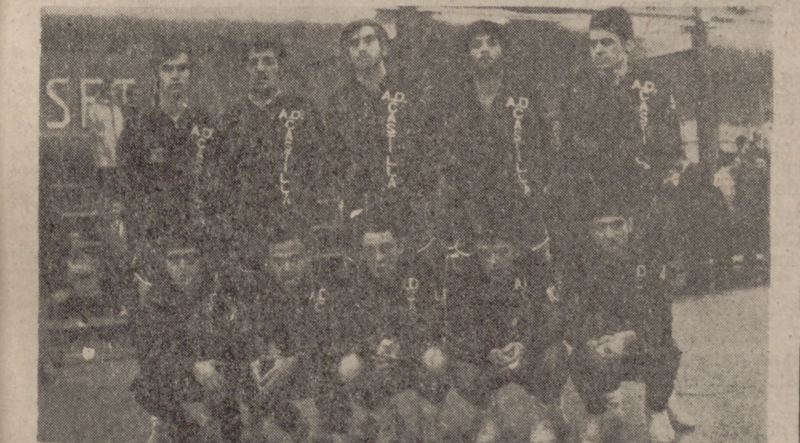
El Castilla-Jher, brillante vencedor del Hunosa, convenció a todos esta vez.