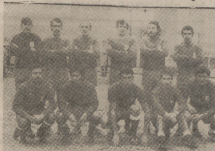
El Simancas, que en una inspirada mañana vapuleó al Instituto Nacional de Colonización-Volvo.

El encuentro G. Medinense - San Carlos no pudo concluir por la nieve