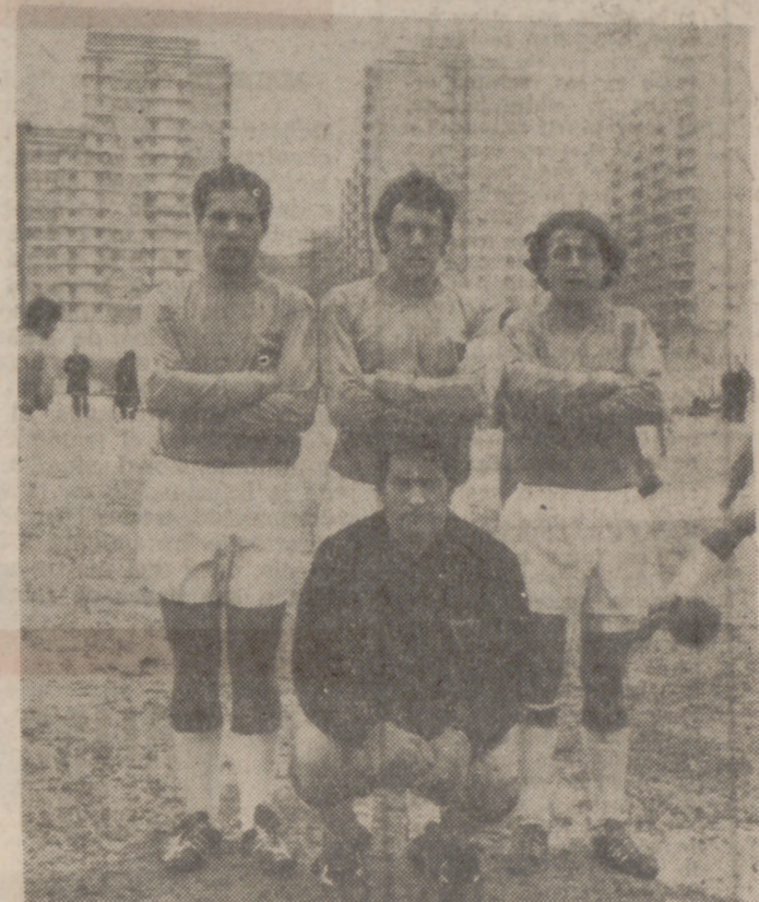
Esta es la retaguardia del INC-Volvo, que ayer no tuvo su día.

Nadie creía, con dos-cero a favor del Arcés, en la posibilidad de una victoria del Santa Teresa; pero los muchachos de este equipo sí tenían fe en la victoria, y mientras el Arcés se dormía en los laureles del dos-cero, el Santa Teresa ponía toda la carne en el asador, luchando y no dando un balón por