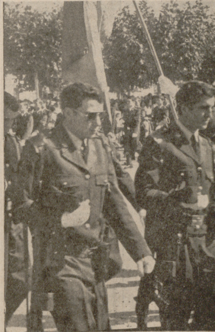
El hijo del Ministro de la Gobernación, en la jura de la Bandera.

A derecha e izquierda de la presidencia se instalaron diversas tribunas, ocupadas por las esposas de las personalidades e invitados. Alrededor del recinto del patio de armas, numeroso público presenció la misa de campaña, juramento de la Bandera y desfile de las fuerzas.