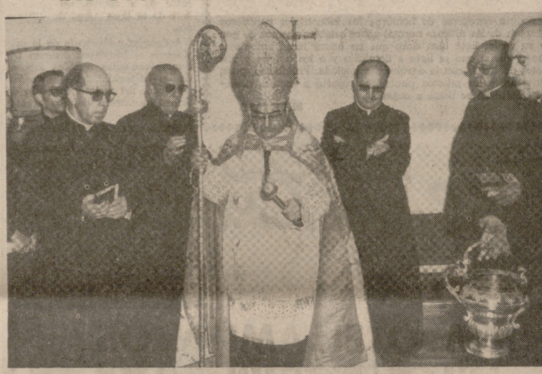
El Arzobispo, bendiciendo las nuevas instalaciones.

El sábado, a las seis de la tarde, fueron bendecidas e inauguradas las nuevas instalaciones de las oficinas del Secretariado Misional de la Diócesis, en la calle Leopoldo Cano, 14.