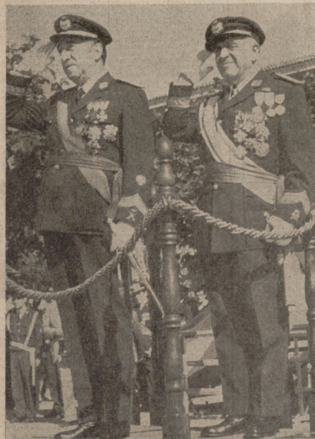
El Ministro de la Gobernación y el Teniente General Jefe de la I Región Aérea, presenciando el desfile de las tropas.

Ayer se celebró el emotivo acto de la jura de la Bandera en el Pinar de Antequera, del cual ofrecemos información en la página tercera.