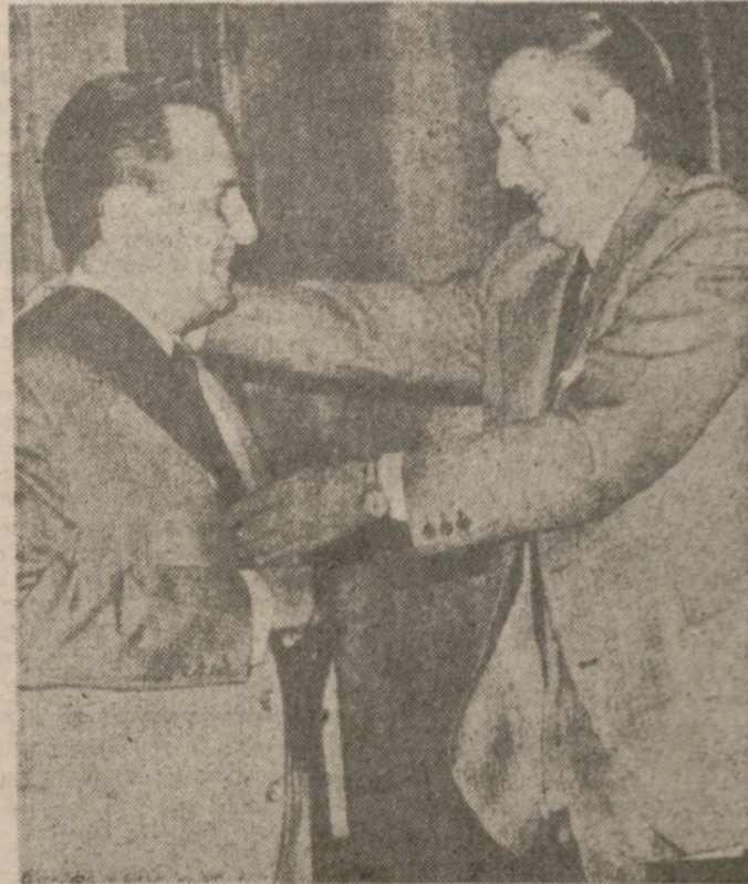
Momento de la imposición de la condecoración.