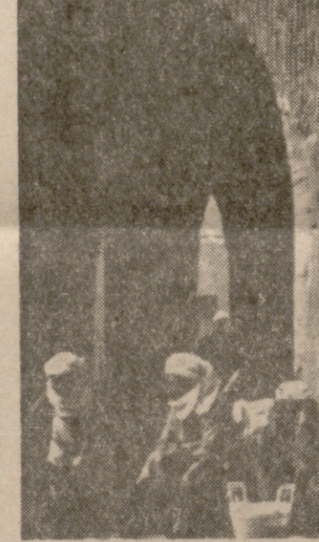
El tipismo de los zocos —sólo para hombres— se repite.