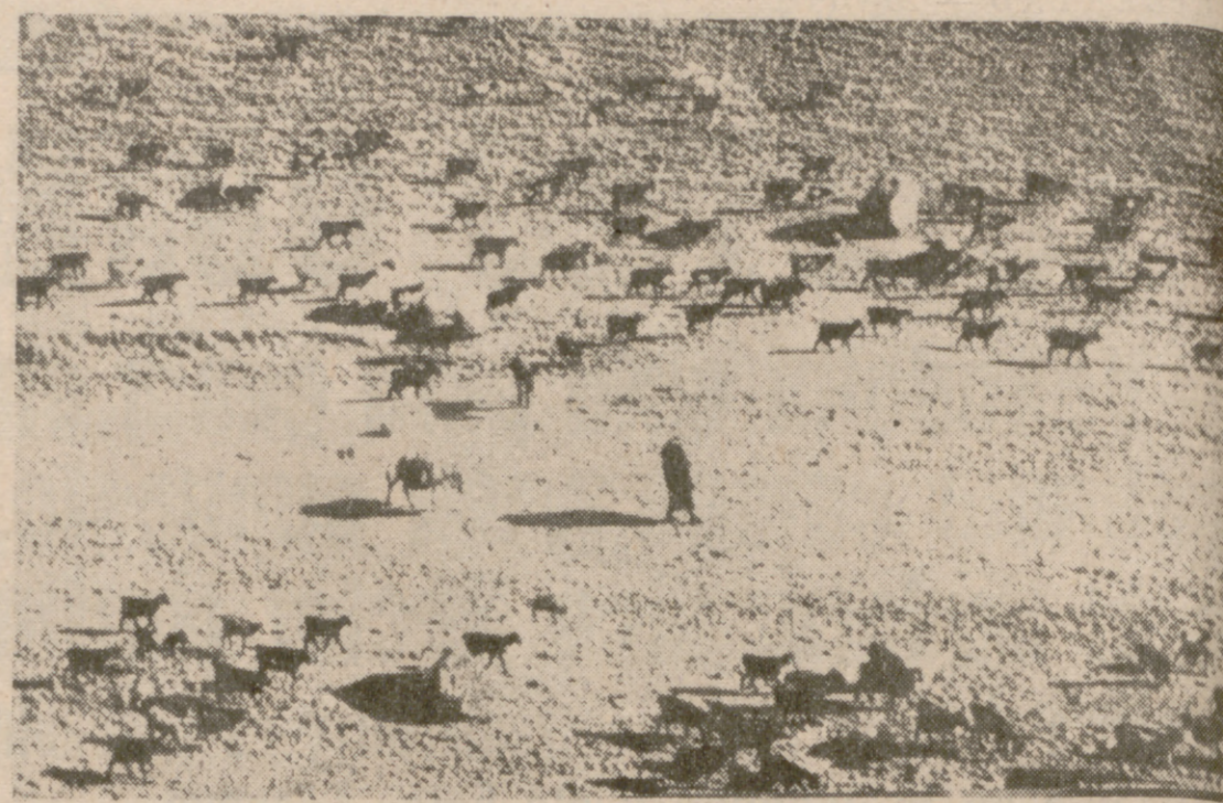
Pastor y ganado en el mayor desierto del mundo.

Las gentes del Haraïn y del Hogar creen que se perdió una bomba atómica en el desierto.