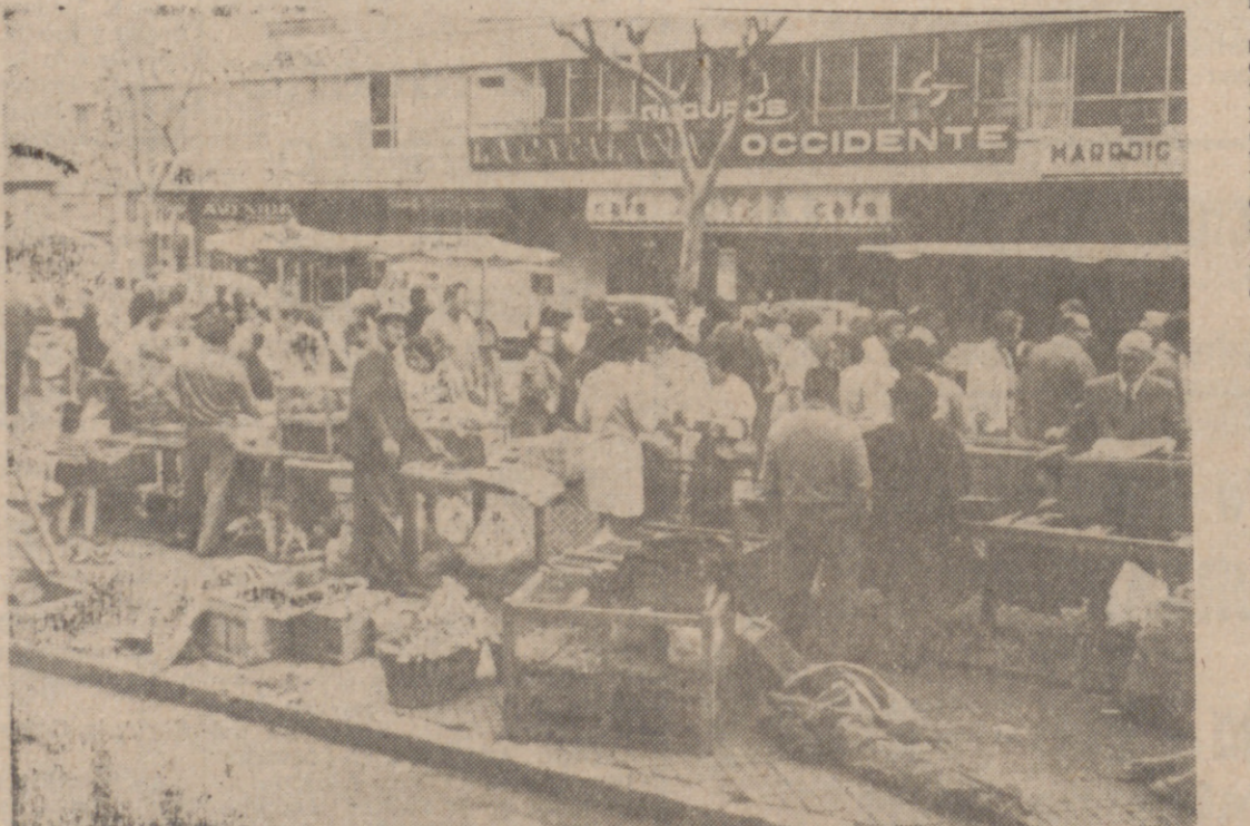
En los mercados palmeños, abundancia de pollos y conejos. El contenido de las jaulas desaparece pronto.