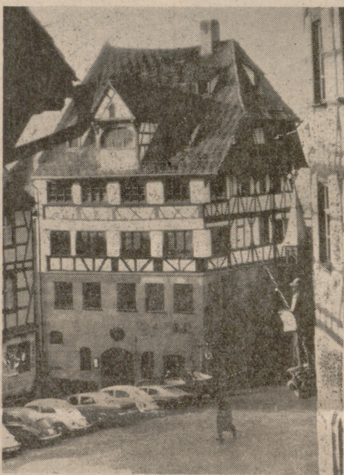
Ahora que se celebra el V Centenario de Durero, ha sido restaurada la casa en que vivió el insigne artista.