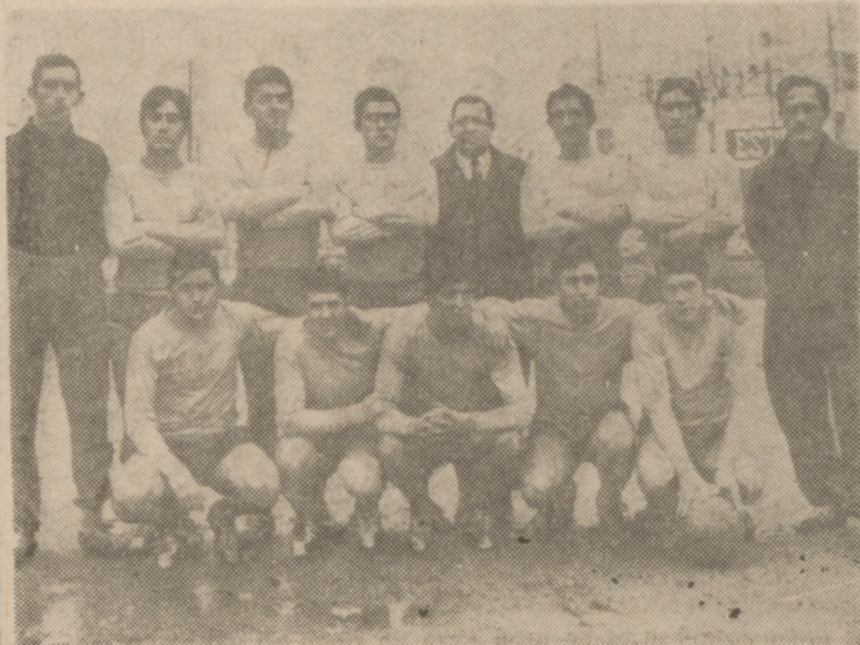
El Iscar, que ha dado un gran paso hacia la consecución del primer puesto.