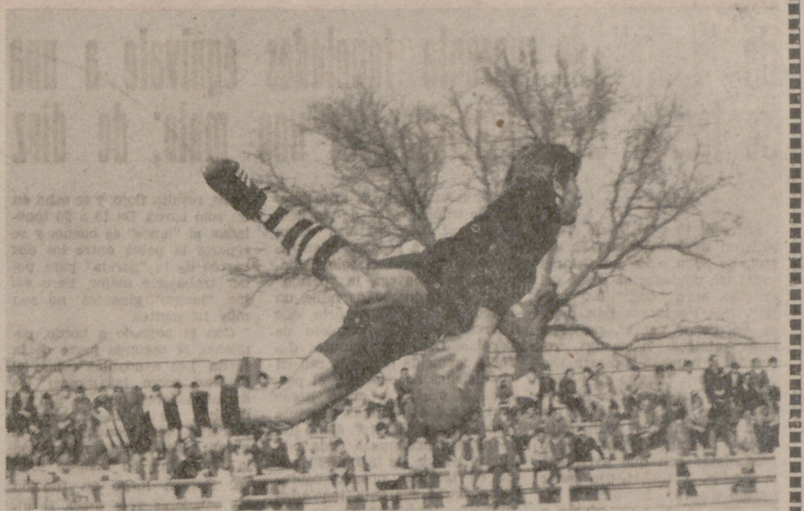
Esta es la fotografía premiada. Ninguna palabra para definir mejor la justicia del premio que la propia imagen.

«He elegido el rugby como tema por su extraordinaria espectacularidad»