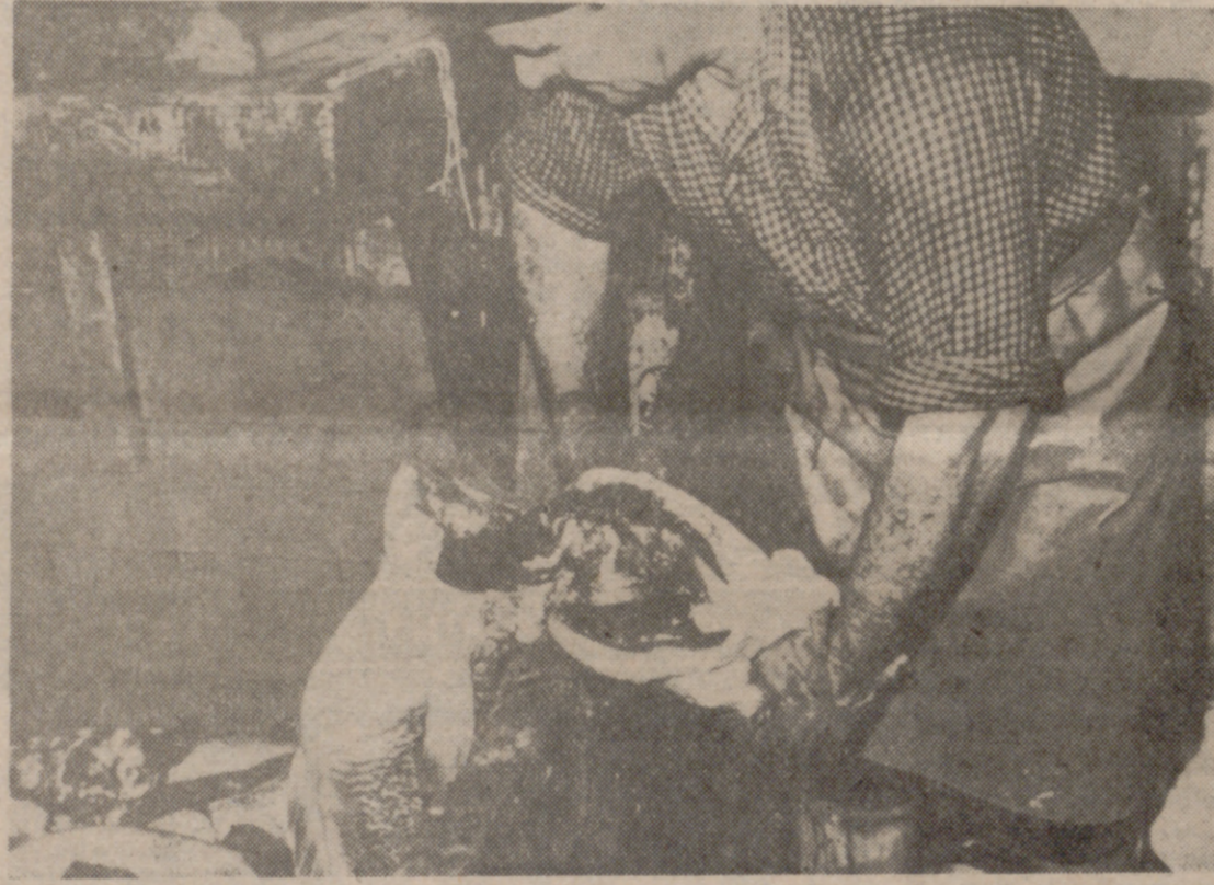
Los marineros, además de largar y virar la red, son expertos en la manipulación de lo capturado; unos tronchadores, otros cortadores, el de más allá, salador... Es trabajo que conviene hacerlo aprisa para que no se estropee el pescado. Los afilados cuchillos no fallan. Alguna vez, el inevitable accidente.

Poco a poco se va perdiendo de vista toda tierra, mientras