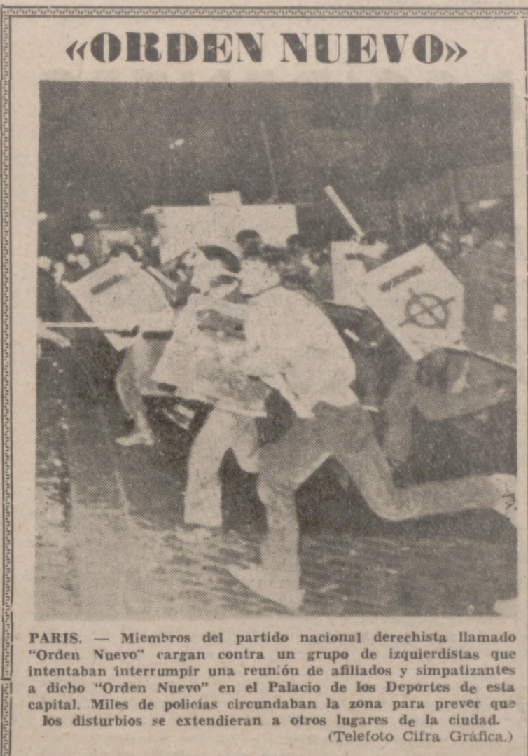
PARIS. — Miembros del partido nacional derechista llamado "Orden Nuevo" cargan contra un grupo de afiliados y simpatizantes a dicho "Orden Nuevo" en el Palacio de los Deportes de esta capital. Miles de policías circundaban la zona para prevenir que los disturbios se extendieran a otros lugares de la ciudad.

Los cuerpos, vestidos de civil, fueron encontrados abandonados en una carretera situada al norte de esta capital.