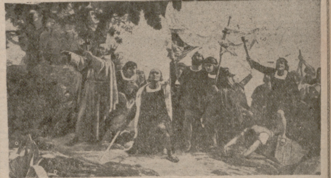
La fotografía reproduce el famoso cuadro de Puebla mostrando a Cristóbal Colón en el momento de pisar tierra en la isla de San Salvador. Pero llegó Colón allí gracias a los mapas de Piri Reis, dibujados cientos o miles de años antes?

No pudieron ser terrestres los hombres que cazaban los dinosaurios a cañonazos