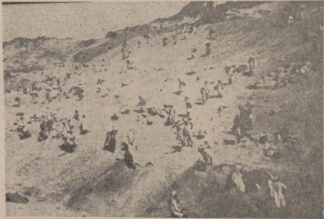
ASSUAN.—Obreros egipcios trabajando en 1960 en los primeros movimientos de tierra para la construcción de la gran presa de Assuan, que va a ser inaugurada oficialmente mañana.

A falta de los dólares denegados ha sido levantada con rublos