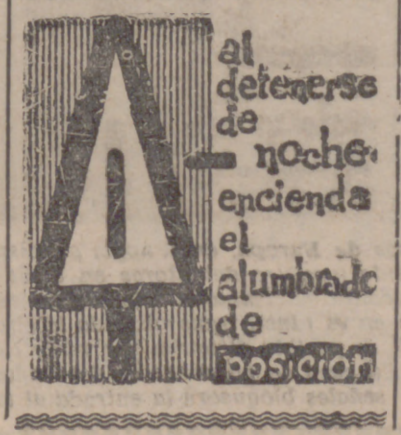
al detenerse de noche encienda el alumbado de posición

«LA SALUD EMPIEZA EN LOS DIENTES! CUIDE SU SONRISA...»