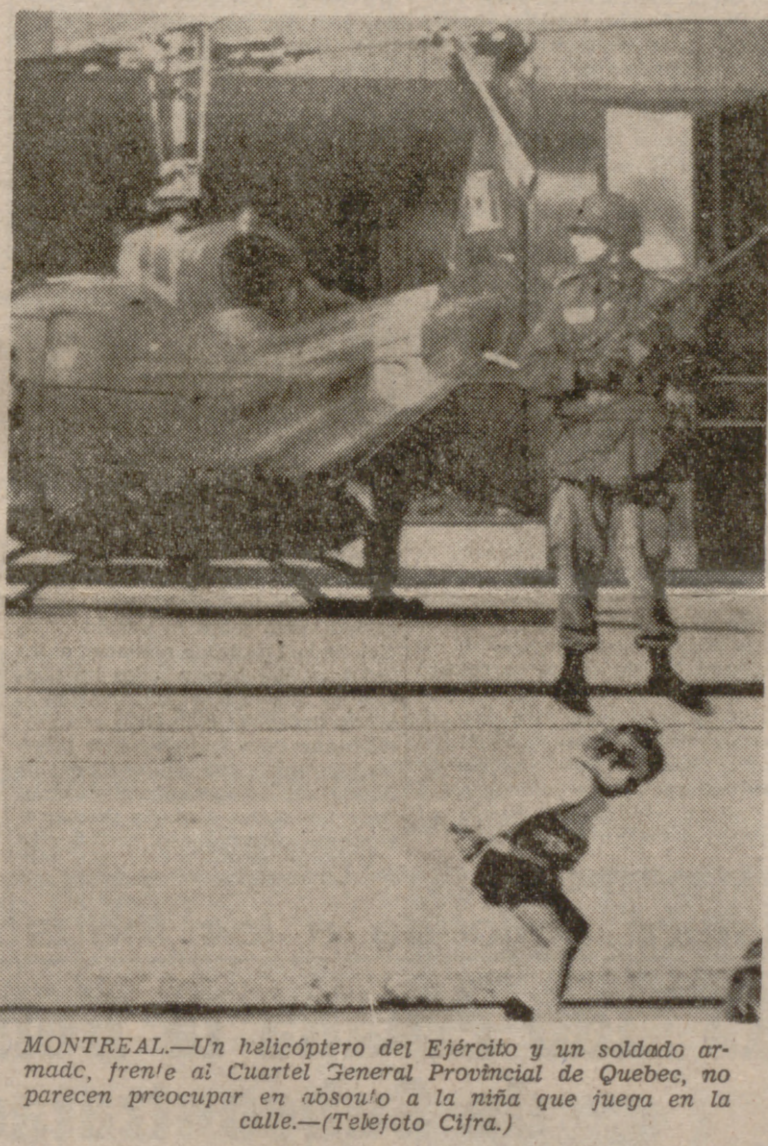
MONTREAL.—Un helicóptero del Ejército y un soldado armado, frente al Cuartel General Provincial de Quebec, no parecen preocupar en absoluto a la niña que juega en la calle.

Sadat se limitó a un mensaje de siete minutos de duración en el que rindió un nuevo homenaje a Nasser, no haciendo ninguna referencia directa al conflicto con Israel ni a los problemas internos de Egipto, salvo decir: "Nos espera una tarea grande y difícil y también una lucha".