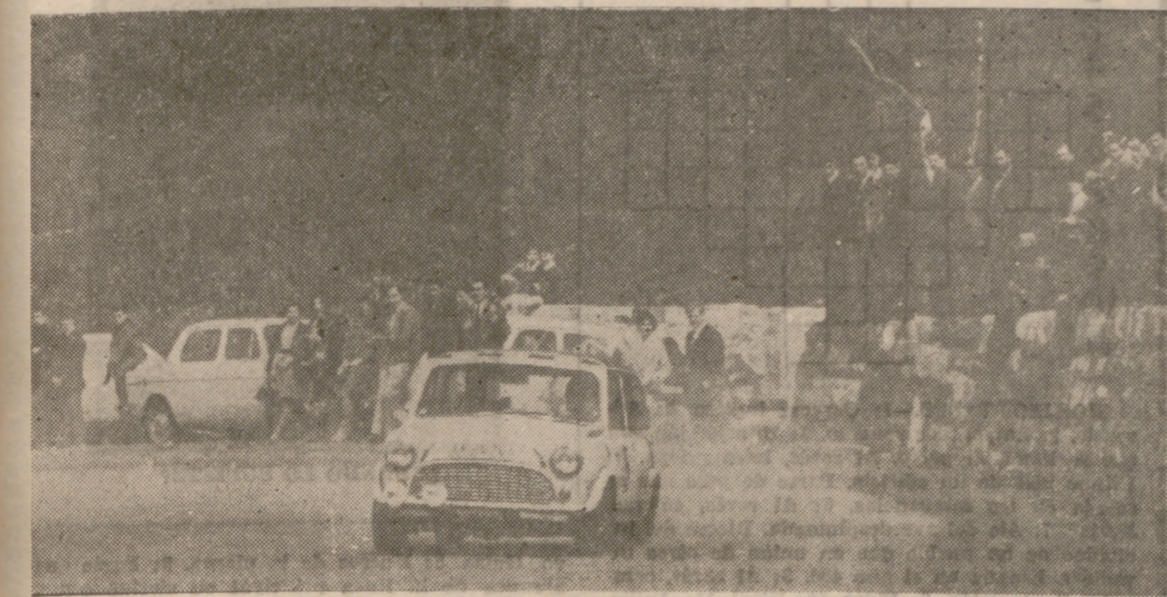
Renace el deporte automovilístico en Valladolid.

Importantes premios en metálico y numerosos trofeos