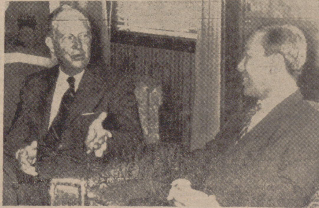
SAIGON.—El secretario norteamericano de Estado, William Rogers (izq.), conversa con el Presidente survietnamita, Nguyen Van Thieu, en el Palacio presidencial, durante el reciente viaje a Vietnam.