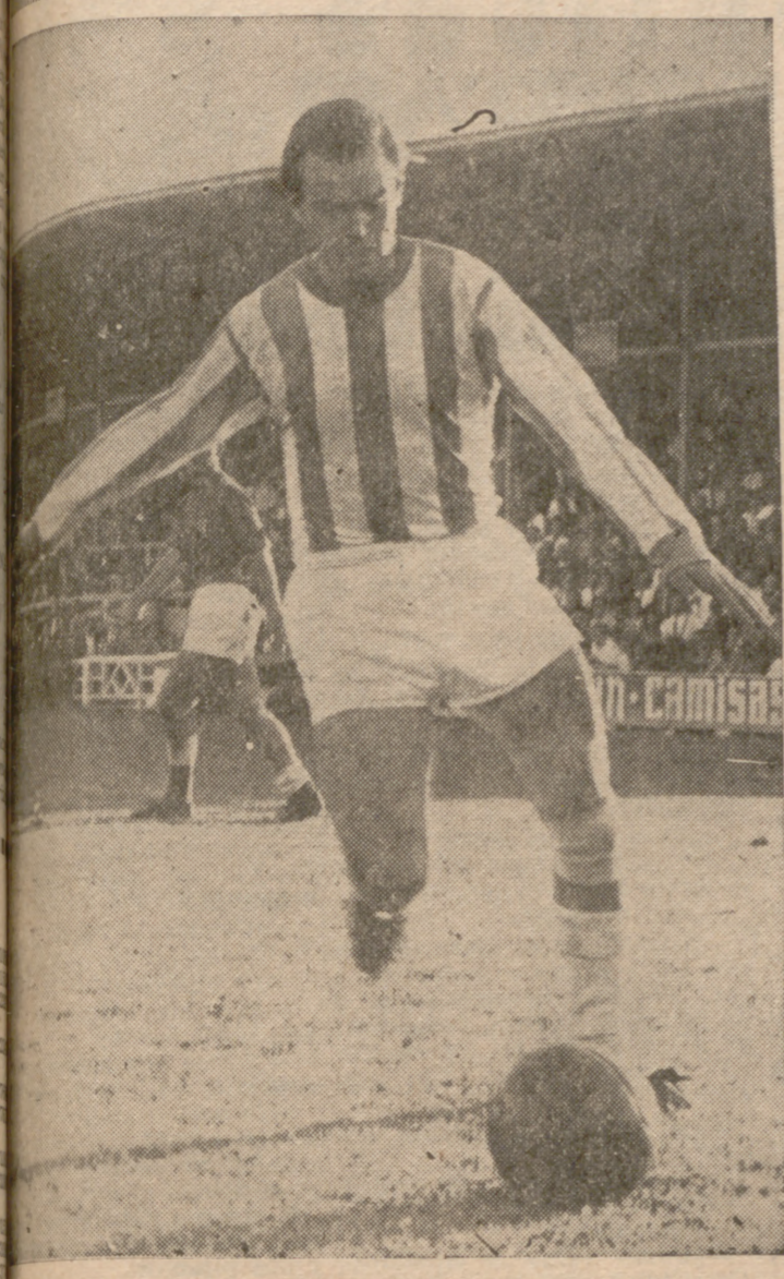
Enderíz fue ojer uno de los jugadores distinguidos del equipo vallisoletano.