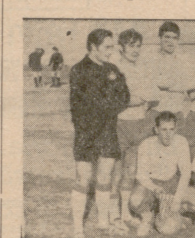
Perdidas sus posibilidades de quedar campeón, el Iscar no rindió como en él es habitual.

A sabiendas de que, tras la victoria del Valladolid, ya se le habían estimado todas las posibilidades de alcanzar el campeonato, el Iscar no rindió como en los últimos encuentros. Pecó de individualismo y careció de garra, y por si fuera poco, se encontró enfrentado con un Girón que iba a por todas, consciente de lo mucho que le iba en el lance.