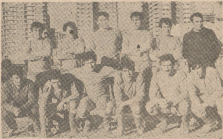
El Azor, condenado al último puesto de la clasificación.

Caso insólito: tres porteros utilizó el Azor