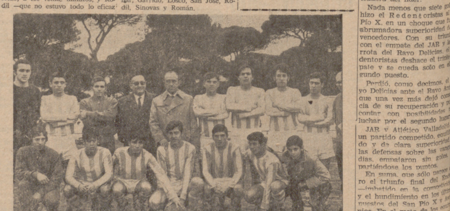
Cuando aún falta una jornada, el Real Valladolid ya es campeón y jugará la fase de ascenso a Tercera. En el grabado, el equipo blanquívioleta cuando todavía contaba con Lastras y Valentín.

En suma, que sólo por el triunfo del Real Valladolid —imbatido en la competición— y el hundimiento en los últimos puestos del San Pío X y Asclepios. El resto de los equipos del equipo no es manifestado en la clasificación puede sufrir en las próximas jornadas muchas variaciones.