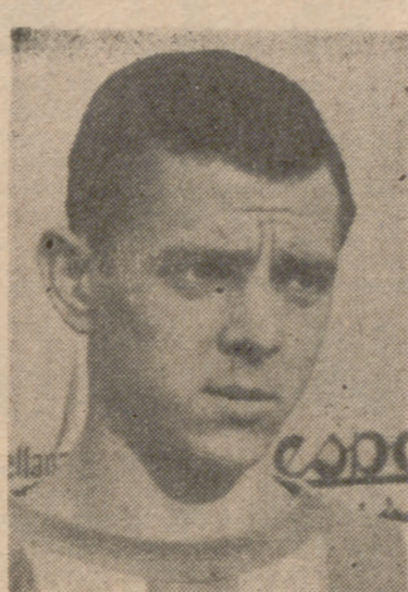
DE LA CRUZ

Primer tiempo En la primera parte, todavía el club titular malagalista logró realizar algunas buenas jugadas y compartirse con su oponente el dominio en el campo. Esta nivelación nacía concretamente del excelente juego que rindió Miguell, quien superaba la ausencia total del juego de Viverril, que bien marcado por Lizarralde desde un principio, en