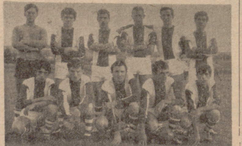
El C. D. Rioseco, que tras su triunfo en Medina del Campo, aumenta sus aspiraciones de ascenso.

(De nuestro corresponsal.) Con el triunfo del C. D. Rioseco por dos goles a cero terminó este partido, el más difícil que tenía el Deportivo en sus salidas de esta segunda vuelta. Victoria merecida y difícil, ya que el oponente de turno, Medina O. J. E., a pesar de su mala clasificación en la tabla, es un equipo elástico, animoso, peleon y no carente de técnica.