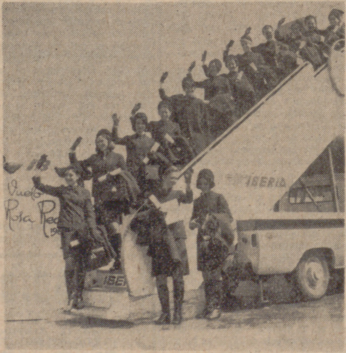
En un vuelo de Madrid a Nueva York, no tienen tiempo ni para sentarse.

Fragment of text from the adjacent page, including words like 'ESPUN', 'HA', 'LA', 'C', 'MOV', 'ORGAN', 'A tenid', 'H la un', 'Ple nca', 'Provincial, q', 'en por el', 'general del', 'José Miguel', 'Que toda cl', 'Vicesecret', 'Organizacio', 'nada—dijo', 'de un te', 'resucitado e', 'las: el Mov', 'Organizacio', 'mento Org', 'puede haber', 'clase de M', 'más adelan', 'uede bien', 'propósito de', 'General no s', 'ancia del M', 'rganización', 'la revitaliza', 'D os ide', 'cabe de', 'tas az', 'Miguel Ort', 'camera de e', 'en la existe', 'mento Orga', 'posible la', 'ninguna otr', 'mento. Et', 'de deবাদ', 'Principi', 'ates se pro', 'mente sobre', 'sía: si se q', 'conformar', 'encia y nu', 'económica y', 'ción de la t', 'Principios', 'Comitente', 'se aparece', 'prantia de', 'no puede', 'realidad. Po', 'mento. Or', 'estiera, la', 'Principios s', 'ducido (com', 'o ante el O', 'al) al terr', 'claraciones', 'en ningún c', 'realidades p', 'técnicas.