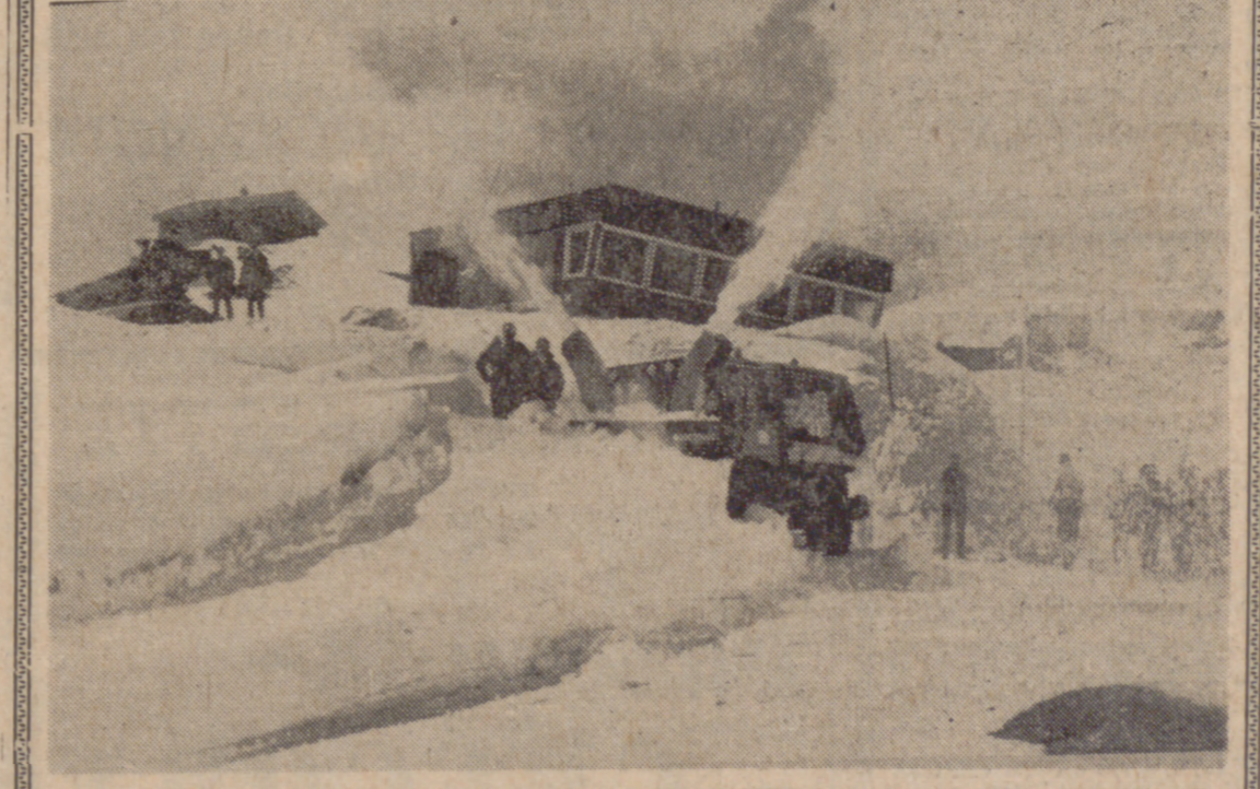
HAMBURGO (República Federal de Alemania).—Los habitantes del norte de la República Federal de Alemania fueron plagados por una catástrofe invernal calificada de la más grave desde hace años. Trenes se embarrancaron en el temporal de nieve, coches desaparecieron en dunas de nieve de tres metros de altura, muchas aldeas quedaron durante varios días aisladas por completo del ambiente. Los quitanieves de la región septentrional de Alemania no alcanzaban, teniendo que pedirse refuerzos al sur del país. Y esto a pesar de haberse preparado la ciudad de Hamburgo bien para la lucha contra el invierno: el Servicio de Limpieza dispone de 5,3 millones de metros cúbicos de nieve que ya sólo 400.000 marcos corresponden a la sal de esparcir para derretir la nieve en las calles principales. Muchos de los obreros del Servicio de Limpieza disponen de coche y teléfono propios para que, caso de comenzar la nevada durante la noche, quede asegurada hasta el principio del tráfico profesional la limpieza de las más importantes de los 800 kilómetros de calles urbanas. Nuestra foto muestra un moderno quitanieves durante su operación.