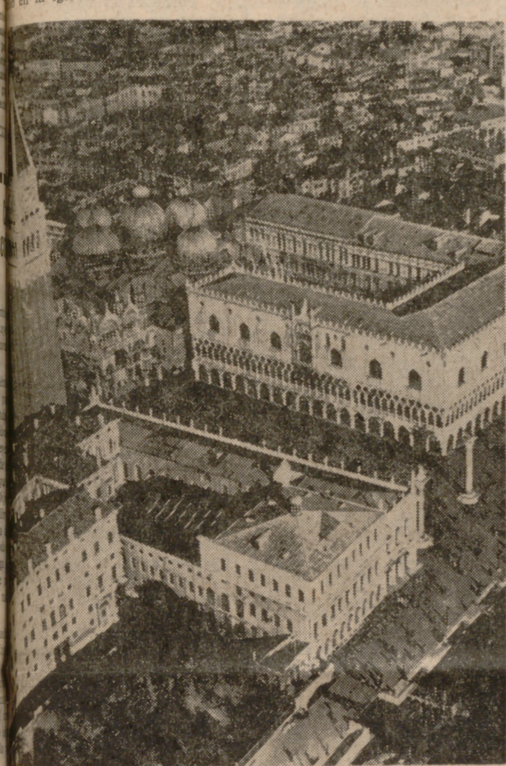
El arte, tesoro de la humanidad entera

Moisés, Venecia será sal... de las aguas. René Maheu... de la Unesco, ha prome... de este organismo in... en favor del rescate de... venecianos. Después de... con total éxito— de... Nubias, la Unesco se... a una nueva misión... del Gobierno italiano... de su incapacidad... la empresa solo, acudió... René Maheu solicitando su... colaboración.