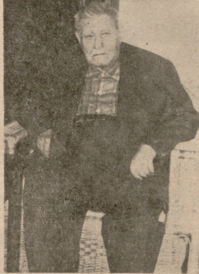
Una de las últimas fotos de Tiburcio Carías.

A la edad de noventa y tres años, y en su tranquila residencia de Tegucigalpa, falleció Tiburcio Carías Andino, abogado político y militar, que ejerció dictatorialmente el poder por espacio de dieciséis años (1933-1948), dejando con su muerte un vacío dentro del Partido Nacional, que actualmente comparte con el Ejército la administración pública de Honduras. Conservador políticamente, Carías Andino se convirtió en un caudillo, manejando al país con mano dura, casi en forma implacable. En los últimos años de su vida se le consultaba para consejos políticos y en forma paternalista trataba a los miembros de su partido. Fervientemente liberal, pero se pasó luego al Nacional, al que vicerizó y llevó al poder, haciéndose su líder y, más tarde, se hizo designar su Jefe Supremo, cargo que desempeñó hasta su muerte.