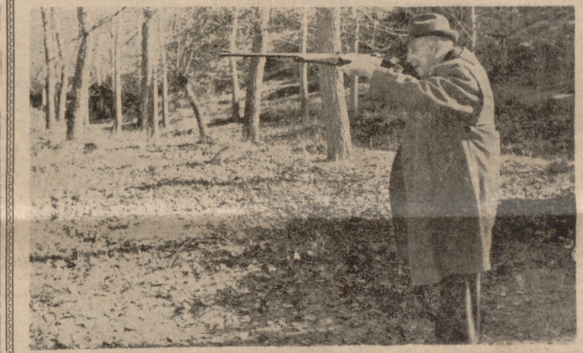
MADRID.—Su Excelencia el Jefe del Estado ofreció el domingo a las personalidades del Gobierno, Cuerpo Diplomático y otras relevantes personas, su tradicional montería, que resultó muy lucida por el número de piezas cobradas. En la foto, el Caudillo disparando a una pieza desde su puesto de caza.

Se entregó el secuestrador de un avión Dice ser el primer pirata aéreo del mundo