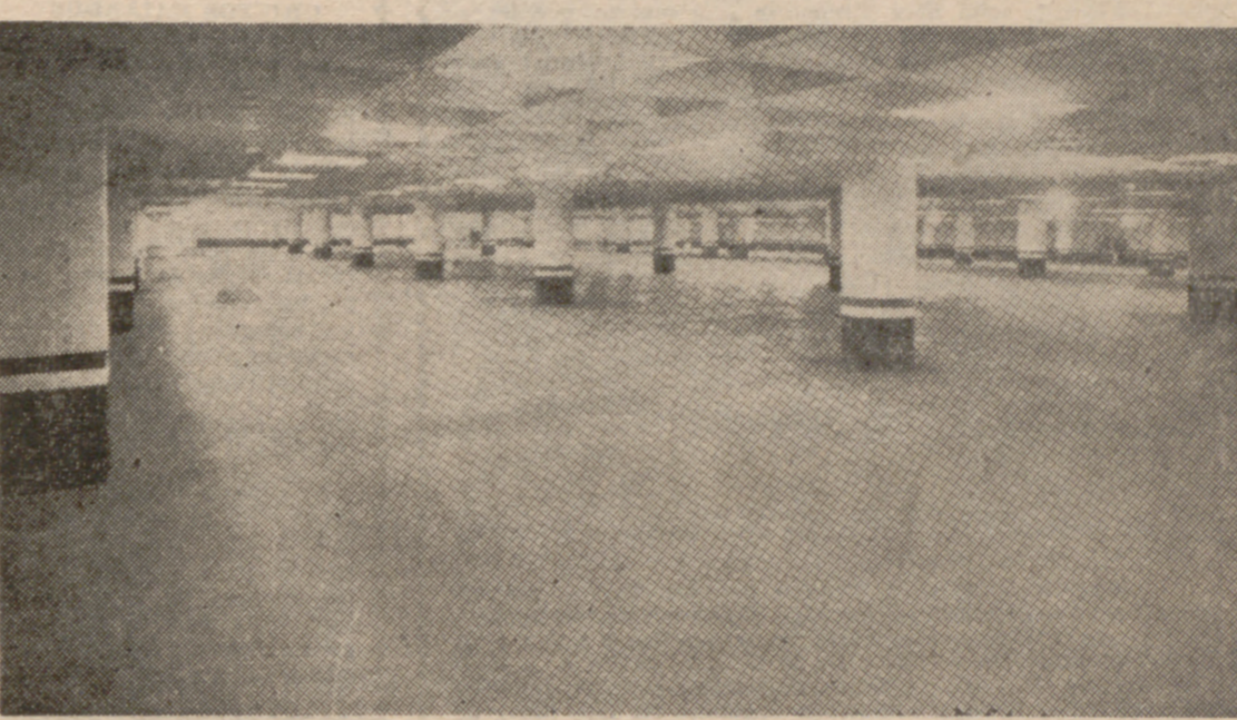
ALGO COMO ESTO ES LO QUE NECESITAMOS

De vez en cuando hay que recordar el peregrino caso de la construcción de aparcamientos subterráneos en el Campo Grande, de Campiello y Plaza Mayor, que anunciados a bombo y platillo llevan camino de quedarse en nada.