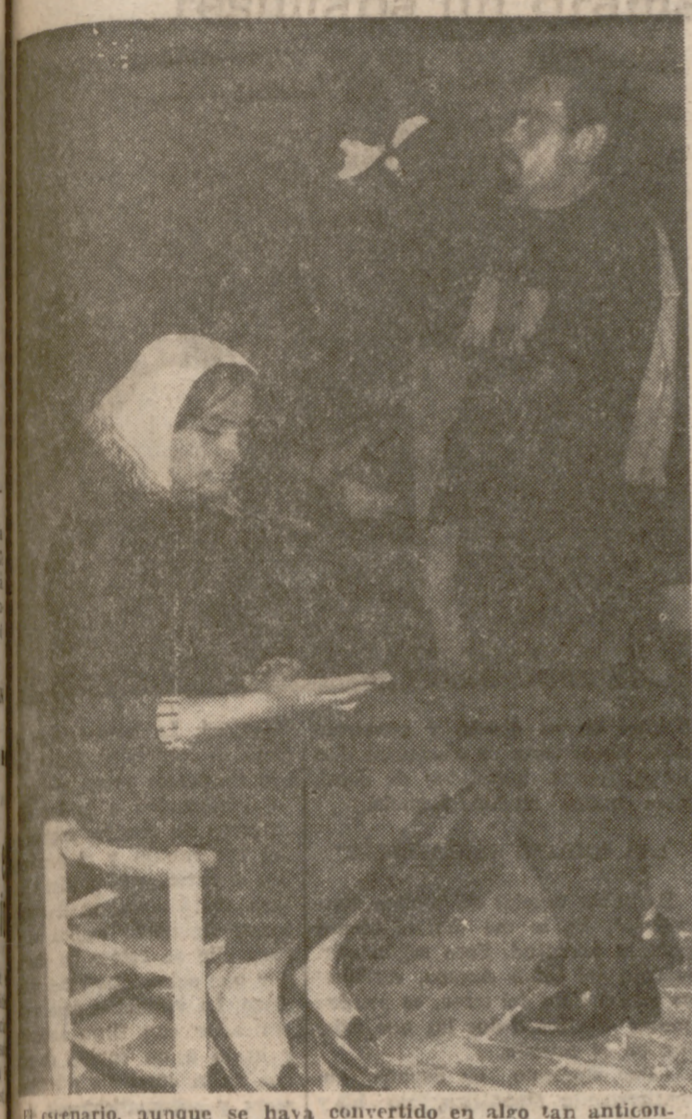
El escenario, aunque se haya convertido en algo tan anticuado como éste sigue siendo el atractivo y la promesa de los actores con firme vocación.

En el orden de la sociedad española de hace años, el que el hijo de familia sintiese la necesidad de la escena constituía todo un drama vergonzoso difícil de soportar.