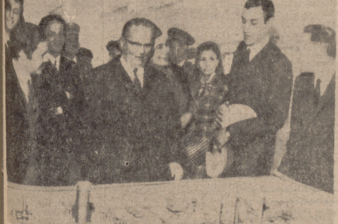
ORAN (Argelia).—El presidente Tito y su esposa, acompañados del ministro argelino de Asuntos Exteriores, M. Abdelaziz Bouteflika, contemplando la maqueta de una factoría petrolífera que será construida próximamente en la región de Orán. Tito ha regresado hoy a Beirut.