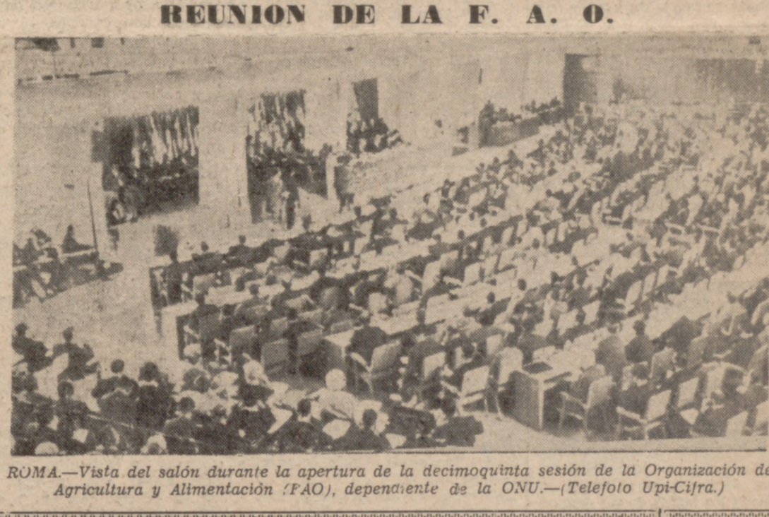
ROMA.—Vista del salón durante la apertura de la decimoquinta sesión de la Organización de Agricultura y Alimentación (FAO), dependiente de la ONU.