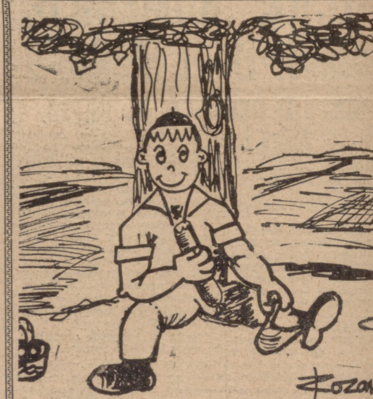
—Qué bien se debe estar en la capital.

por cierto, posee un sistema similar—y, por supuesto, de asustar a China que el año que viene dispondrá ya de cohetes capaces de llevar una carga nuclear al otro lado del Pacífico. El "espíritu de club" existente entre las dos superpotencias y la experiencia de largos años de enfrentamiento hace que rusos y americanos desconfíen menos entre sí que cualquier de los dos de las intenciones de Pekín. Después de los últimos incidentes ruso-chinos a orillas del Ussuri, es posible que Moscú se sienta más dispuesto a aceptar las razones de Washington. El viejo tópico del "peligro amarillo" ha hecho de nuevo su aparición. ¿Qué ocurriría se preguntan todos, si un día no muy lejano los "guardias rojos" chinos dispusieran de armamento nuclear transportable a larga distancia? Ocurriría que, dado el escaso valor que la vida humana tiene en estos hornos guerreros asiáticos, arriesgarían con más facilidad la partida nuclear que Rusia o el Occidente. Por eso para contener a la amenaza chino-comunista es por lo que el más caro centinela de la historia va a entrar a la guardia desde Alaska a las Hawaii. (PYRESA)