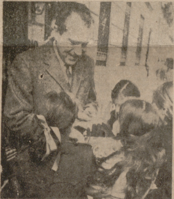
NUEVA YORK.—El presidente electo, Richard Nixon, firmó autógrafos a los niños de una escuela situada enfrente de su apartamento cuando se dirige andando hacia el hotel Pierre, donde tiene su oficina. Nixon tiene programada otra serie de contactos y conferencias con altos cargos para discutir los programas y personas en su nueva Administración.