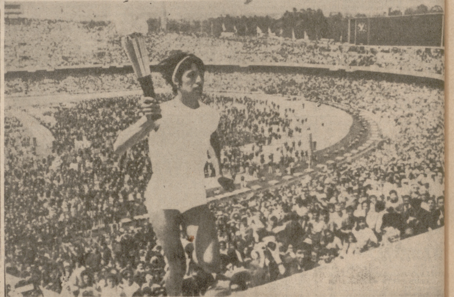
CIUDAD DE MEXICO.—La atleta mexicana Enriqueta Basilio, portando la llama olímpica, se dirige al pebetero para prender la llama que arderá durante la celebración de los Juegos.

El COI y los Comités olímpicos nacionales dirigieron finalmente un mensaje fraternal de paz y amistad a los pueblos y muy particularmente a los jóvenes de todo el mundo.