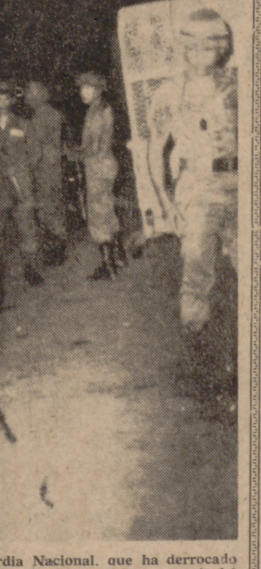
PANAMA.—Miembros de la Guardia Nacional, que ha derrocado al presidente Arnulfo Arias, arrestan a un sospechoso, a raíz del golpe de Estado, sin derramamiento de sangre, ocurrido a las once días de que el presidente Arnulfo Arias se hiciera cargo de la Presidencia.