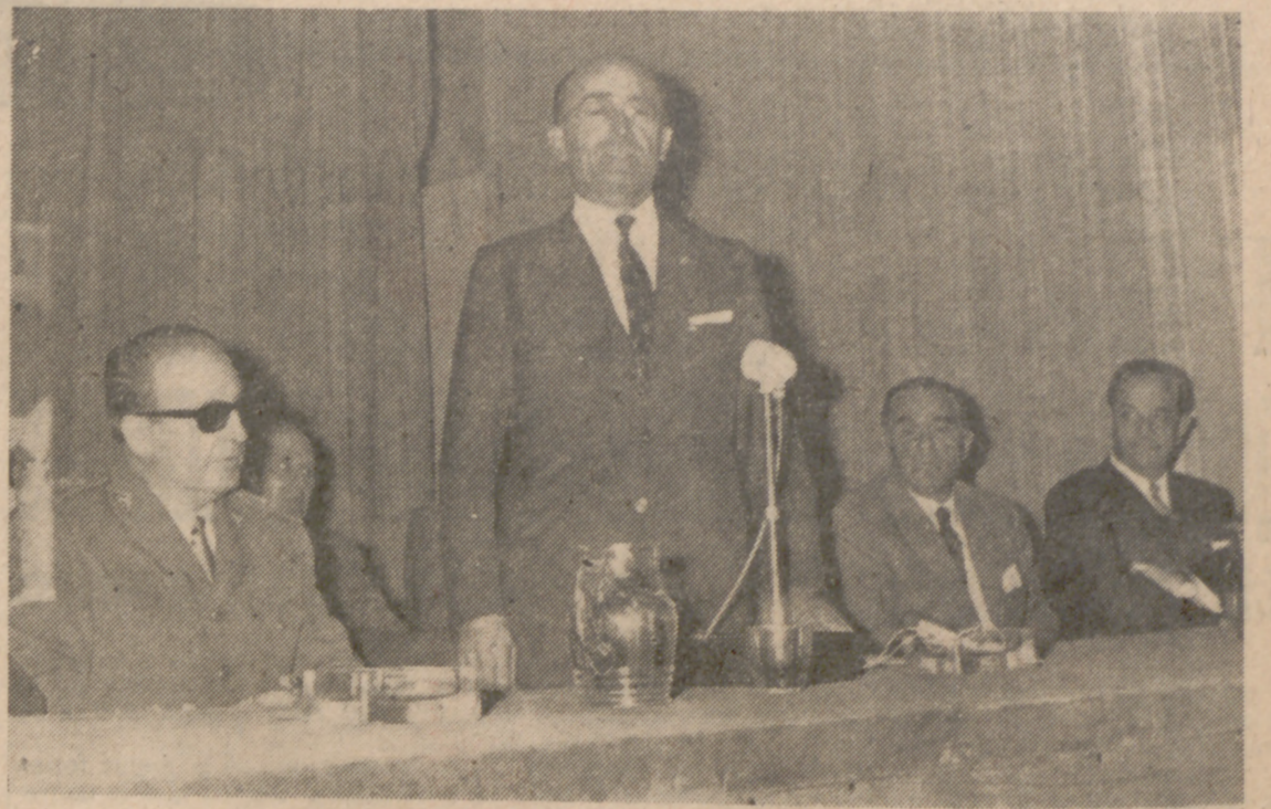
El señor Oriol y Urquijo, dirigiéndose a los asambleístas.