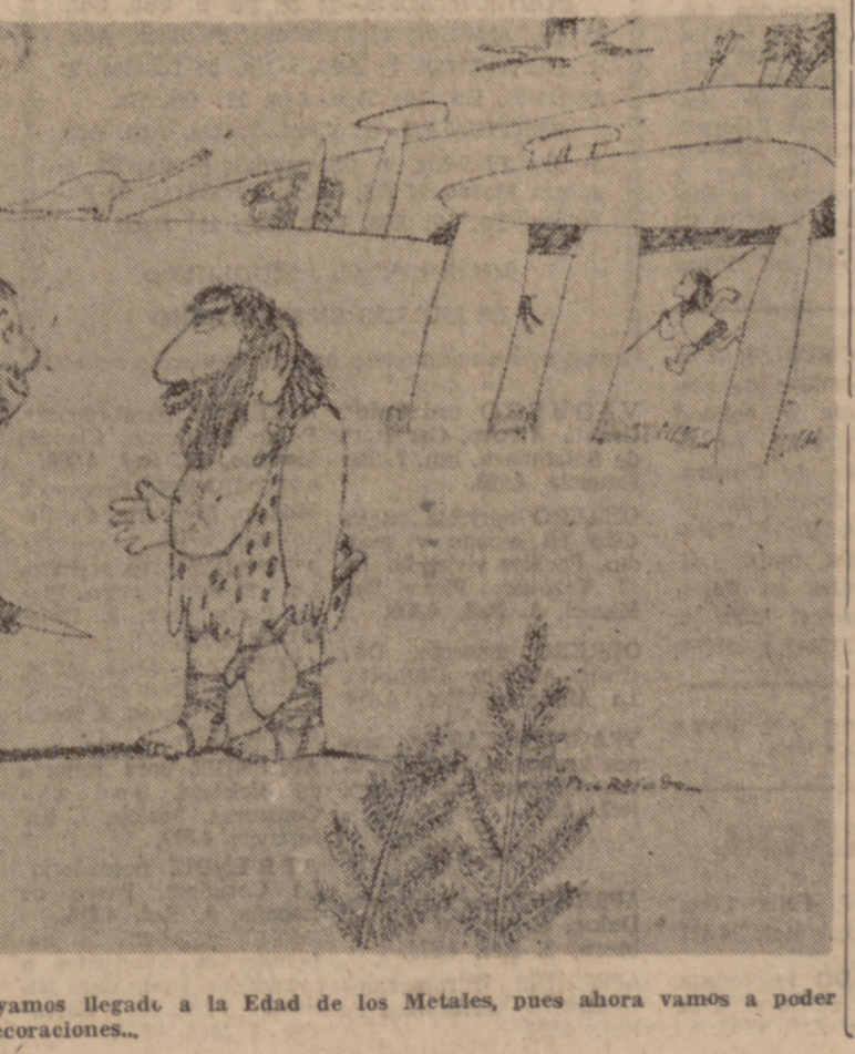
Estoy contentísimo de que hayamos llegado a la Edad de los Metales, pues ahora vamos a poder empezar a ponernos medallas y condecoraciones...

CIGARRILLO NO ENCIENDA NUNCA UN CIGARRILLO CON FOSFORO O MECHERO MIENTRAS CONDUCO, PUES EL DESLUMBRAMIENTO MOMENTANEO DE LA LLAMA ES PELIGROSO. PARA HACERLO, DETENGA SU AUTOMOVIL