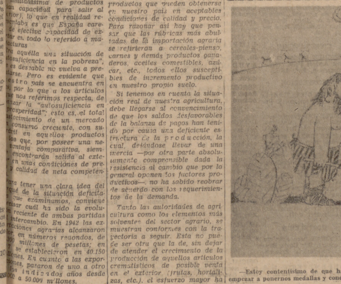
Estoy contentísimo de que hayamos llegado a la Edad de los Metales, pues ahora vamos a poder empezar a ponernos medallas y condecoraciones...

de orientarse hacia la sustitución de importaciones, máxima cuando dicha sustitución no sólo supone un aligero de la carga del comercio exterior de mercancías, sino también una perfección del quehacer campesino de nuestro país, cogido en las redes de su propia insuficiencia, ya que, por ejemplo, la expansión de la caña de azúcar ha sido difícil por la inexistencia de una "fuerte base alimenticia del ganado." De todo, modos, las orientaciones actuales constituyen una evolución, de la que cabe esperar, con el suficiente grado de autosuficiencia, una situación positiva de la balanza agraria.