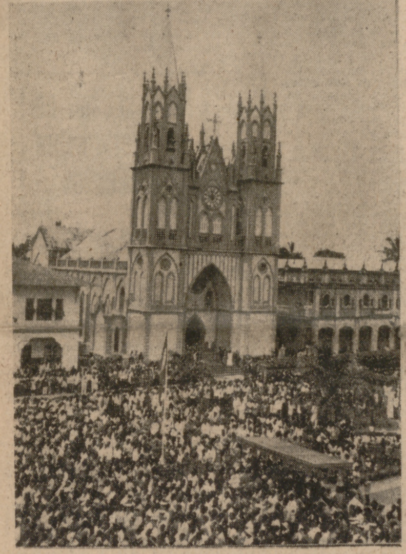
SANTA ISABEL DE FERNANDO POO.—Aspecto de la Plaza de España durante los actos de la proclamación de la independencia de Guinea Ecuatorial.

MADRID. (Cifra).—El Ministro de Información y Turismo, en funciones de Ministro de Asuntos Exteriores, a su llegada al aeropuerto de Barajas, de regreso de la transmisión de poderes al nuevo Gobierno guineano, dijo a los informadores: "En primer lugar, mi impresión de estos dos días inolvidables es de una profunda emoción."