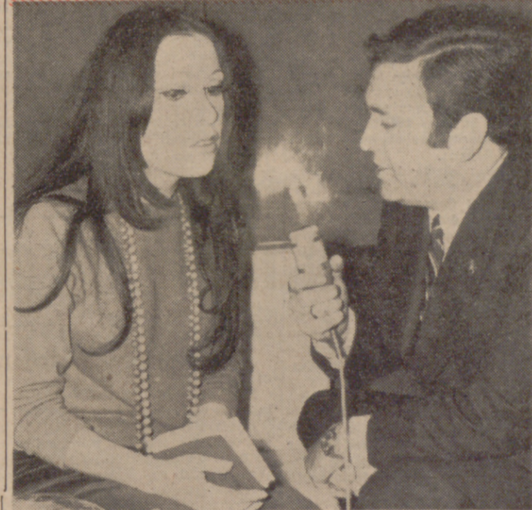
MADRID.—Massiel, en el aeropuerto, a su llegada de Méjico, reclamada por Televisión Española. En la escalera del avión lo confirmó en una entrevista con José Luis Uribarri.

MADRID. (Cifra).—Massiel será la cantante que representará a España en el Festival de «Eurovisión», tras la renuncia de Juan Manuel Serrat.