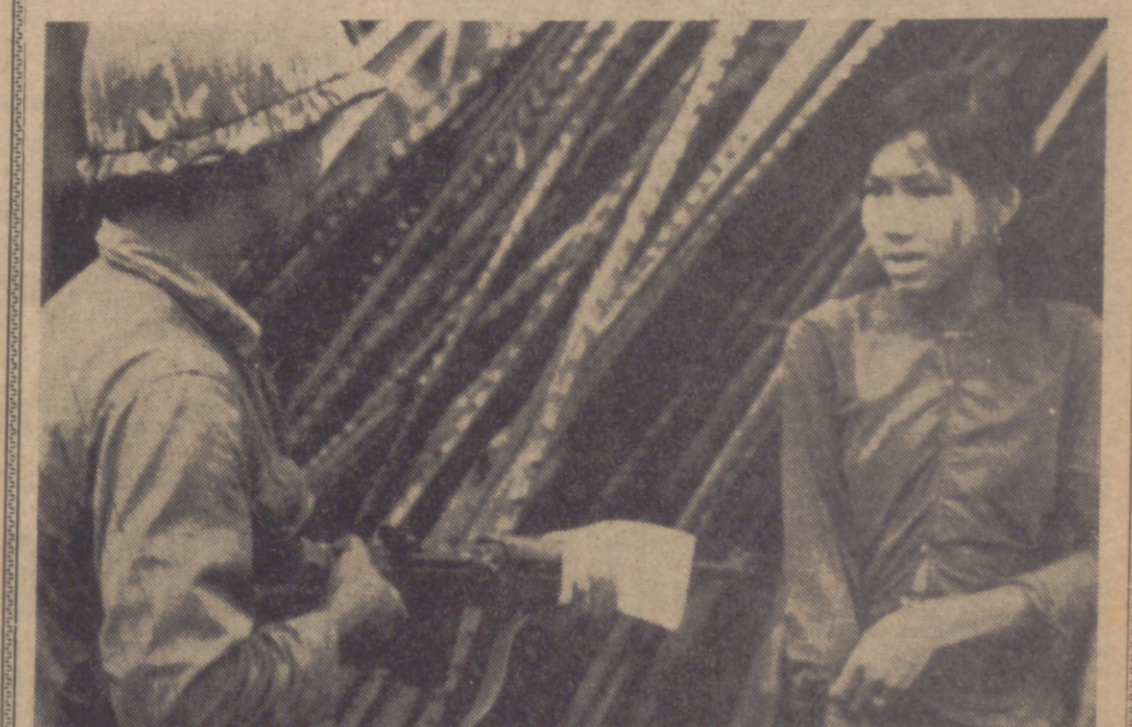
DONG SON (Vietnam del Sur).—Un intérprete vietnamita de la I División de Caballería interroga y apunta con su fusil a una joven durante una operación de limpieza y búsqueda en un poblado.