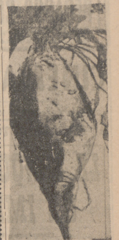
noce la gran calidad humana de los agricultores españoles.

Dijo después que los graves problemas que tiene pendientes de solución el campo van a ser resueltos, no sólo porque es propósito decidido del Gobierno, sino porque co-