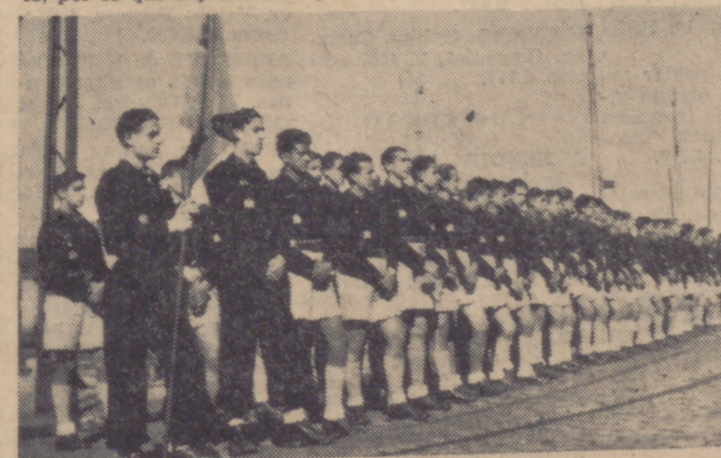
hulados del Movimiento en que voluntariamente estaba encuadrada, la juventud sabía morir con esperanza. Ningún otro motivo le llevaba a intervenir en aquel referéndum drama nacional. Para la juventud nada contó a la hora de sacrificarse, ni los aficionados a la holganza política, ni los ahorantes de inútiles e irritantes cortesías, ni el secular y mostrenco alarde que