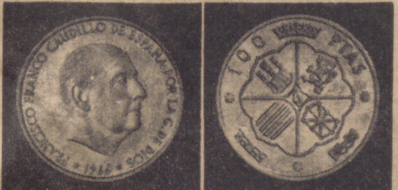
Así son las monedas de plata, des de hoy en circulación. La composición de las mismas es de 800 milésimas de plata y 200 de cobre.

Se agotaron las monedas de cien pesetas en Madrid