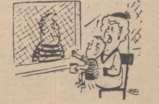
—Vamos, niño, no le des cacahuets a tu padre.

HORIZONTALES.—1: Obstruido. 2: Aplicaré la nariz. 3: Que comete traición. 4: En plural, artículo. Labras. 5: Al revés, río de Europa. Al revés, mides el precio. Nombre de letra. 6: Letra griega. Al revés, obedezca. Al revés, personal. 7: Al revés, nota musical. Al revés, manoseas. Nombre de letra. 8: Al revés, demostrativo. Ensalza. 9: Respondera en algún préstamo. 10: Recuerda. 11: Figure como principal en algún Consejo. VERTICALES.—1: Perfumado. 2: Pone un mote. 3: Clerta carta de la baraja. Matrícula de coche española. 4: Al revés, personaje bíblico. Al revés, contrariedades. 5: Exclamación popular