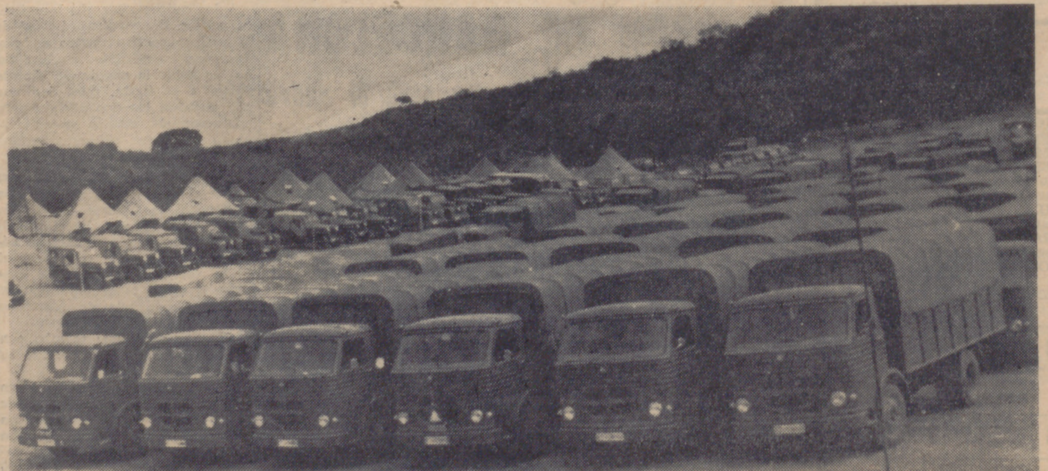
VALENCIA DE ALCANTARA.—Una vista del parque automovilista de las fuerzas españolas que participan en "El Salado", maniobras que las fuerzas españolas y portuguesas llevan a cabo en este lugar fronterizo.