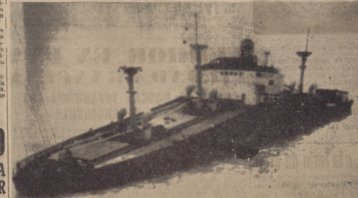
THEVENARD.—El mercante griego «Eleni K», con su popa partida, fotografiado a ocho millas de esta costa inglesa. Desplaza 7.245 toneladas y es portador de un cargamento de trigo consignado desde Australia a Londres. Las autoridades investigan las causas del accidente.