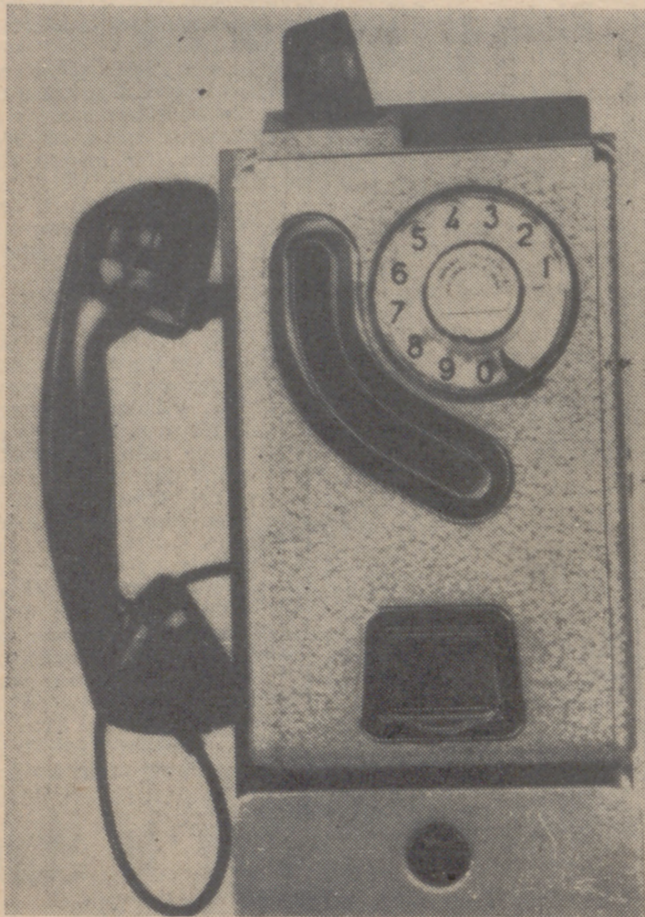
PESETAS EN VEZ DE FICHAS

Los encargados de la seguridad pública siguen con los presupuestos y recursos de hace diez años