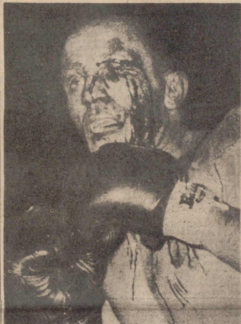
TODO ACABADO.—Con el rostro bañado en sangre, Cooper parece adivinar que el final está próximo. Instantes después, el árbitro detendría la pelea... y el castigo.