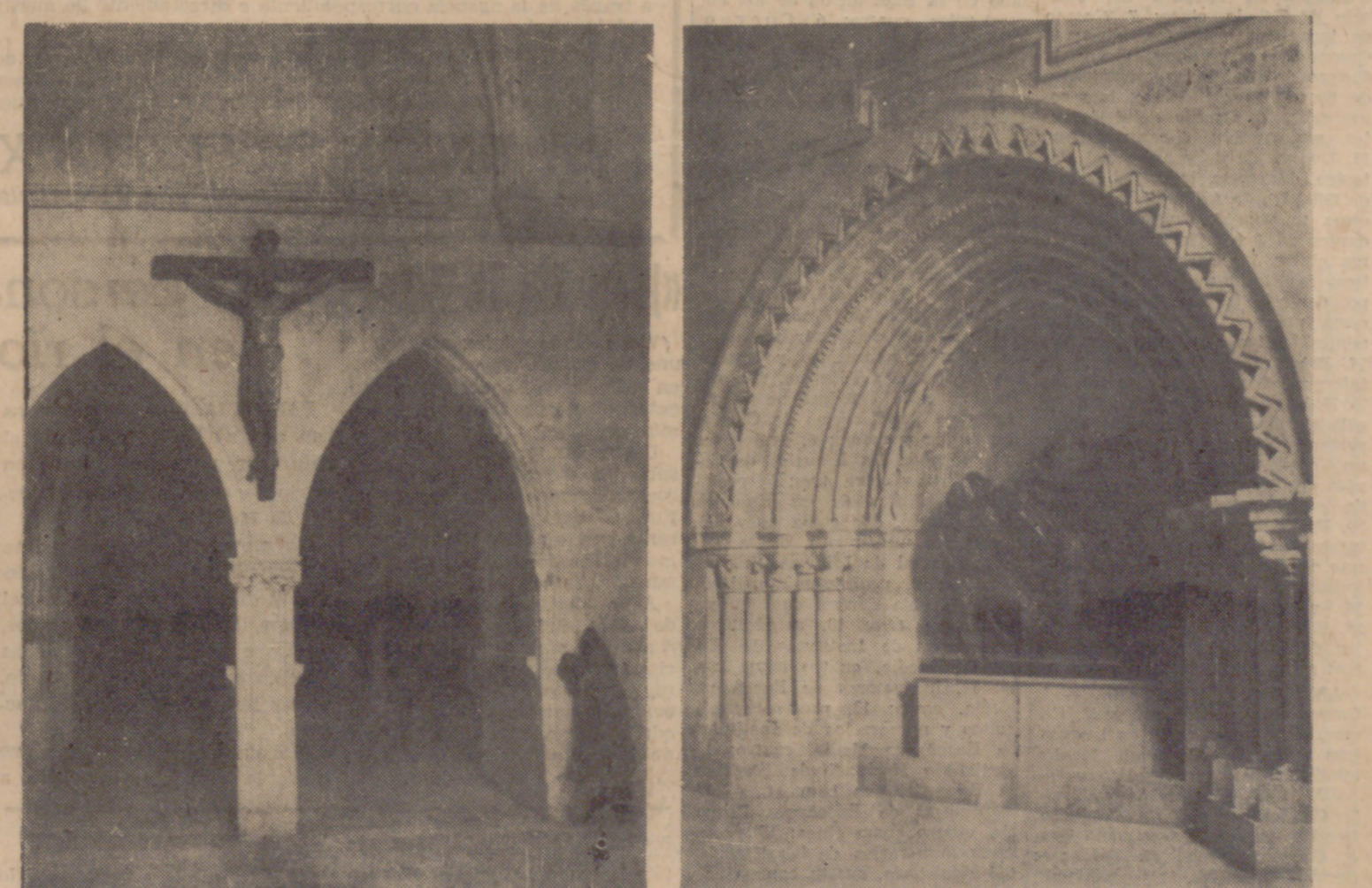
(INFORMACION LITERARIA Y GRAFICA EN PAGINA QUINTA.)