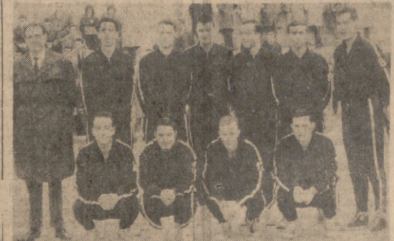
El Real Valladolid, que cerró la temporada con un gesto que dice muy poco en su favor...

El primer tiempo finalizó 44-30 a favor del equipo español.