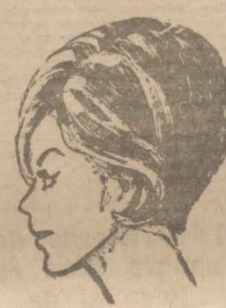
de laca, pero sólo la suficiente.

Y ya está...; para las que tienen el pelo corto han de ponerse tubos de vez en cuando para que el peinado quede más húscu.