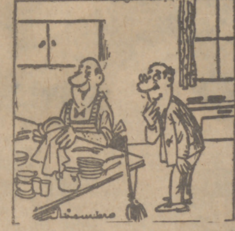
Puedes contarme tranquilamente eso del plancillo. Mi mujer jamás pone aquí los pies.