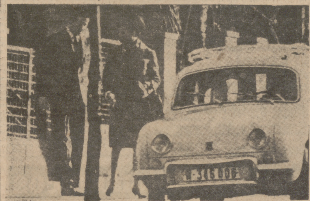
La princesa Ana y Carlos de Borbón se habían conocido en Atenas, cuando se casó Sofía de Grecia en mayo del 62. El conde de París había impuesto a su hija Ana y a Carlos un año de separación para poner a prueba sus sentimientos. Ana se retiró a Louveciennes (en Francia) y Carlos hizo un viaje de estudios a los Estados Unidos. Transcurrido el año, el padre de la princesa no ha podido negar el consentimiento al noviazgo con Carlos. El compromiso se ha anunciado oficialmente. Ambos tienen veintiséis años. La boda se celebrará probablemente en París. En la foto vemos a ambos jóvenes en una calle de Madrid.