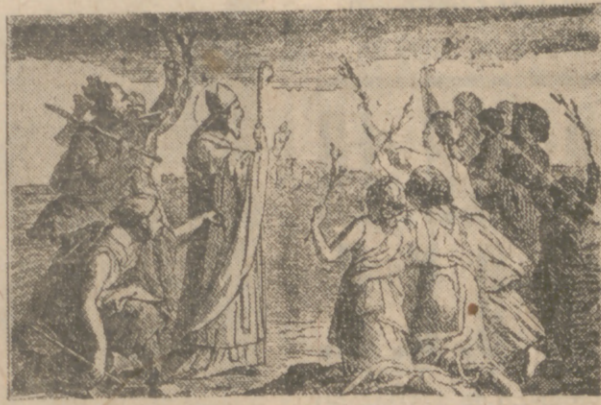
SAN HILARIO, OBISPO Y DOCTOR († 388)