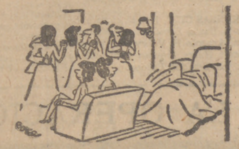
Hazte la distraída. El joven tímido de que te hablam antes se está acercando.

(SOLUCION AL CRUCIGRAMA EN LA SECCION DE ANUNCIOS ECONOMICOS)