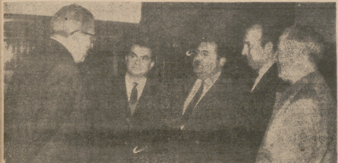
La Junta Directiva de la Peña Taurina "El Cordobés" visitó ayer a nuestro Jefe Provincial, a quien hizo entrega de un importante donativo con destino a la suscripción para la Campaña de Navidad y Vivienda. El camarada Ruiz-Ocaña, con elocuentes palabras, agradeció el gesto de la recién creada Sociedad. En la foto de Carvajal, un momento del simpático acto.