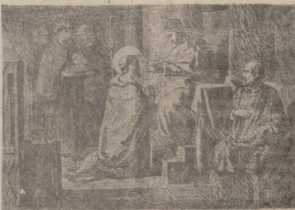
EL SANTO DEL DIA

hartar de dar trabajo a la sin hueso. Hablan de todo, por lo que dicen, y gobiernan a su gusto cuatro o cinco horas consecutivas, mientras los maridos se ven mal para perder quince minutos una vez al mes al cortarse el pelo. Parece seguro que por cada barbería cerrada han abierto dos peluquerías de señora, y todo esto viene a cuento de que durante una reciente reunión celebrada en Madrid, los empresarios o empresarios de peluquerías de esta clase se han quedado de que va siendo hora de dignificar la profesión un poco más, prohibiendo que sean abiertos nuevos establecimientos por personas no capacitadas o sin título, aparte de que empiezan a ser bastantes los veinticinco r il