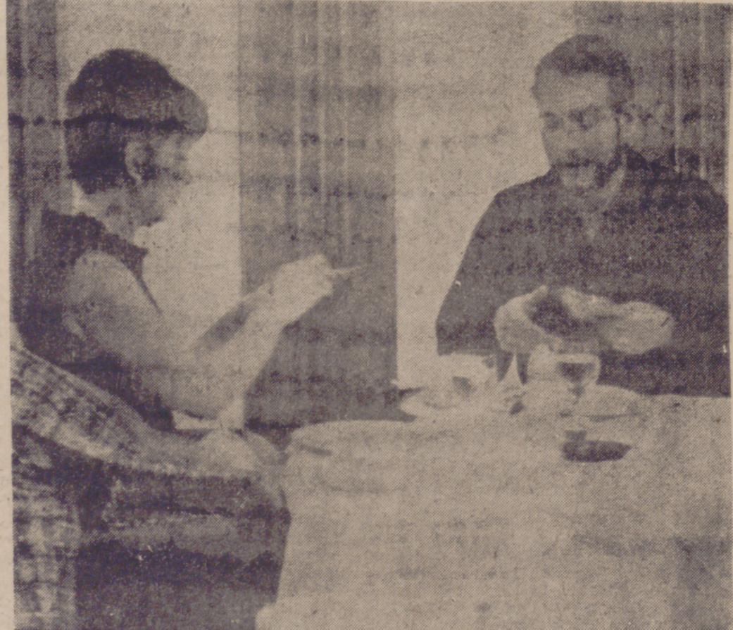
Joanne Woodward y Paul Newman están consuetudados como "el matrimonio de actores más feliz de Hollywood". Paul tiene cuarenta años. Antes de dedicarse al cine administraba una hacienda de su padre. Aquí aparece la pareja comiendo en un restaurante de París.