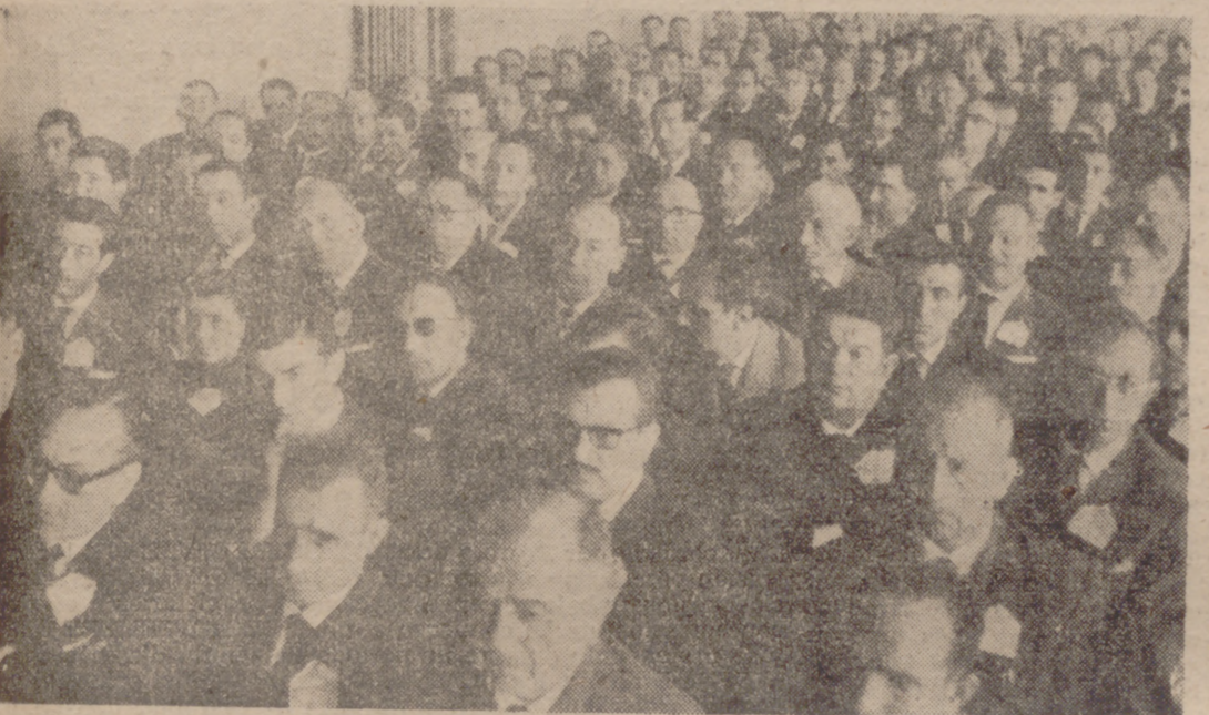
Los asambleístas, en el salón de actos de la fábrica.

Hoy se ha celebrado la Segunda Asamblea General de Distribuidores de Piensos Compuestos