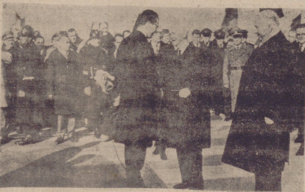
BONN.—El rey Balduino de Bélgica estrecha la mano del presidente de la República Federal Alemana, Heinrich Lübke, en la inauguración de la "Autopista Rey Balduino". La ceremonia se celebró en la frontera entre Alemania y Bélgica.