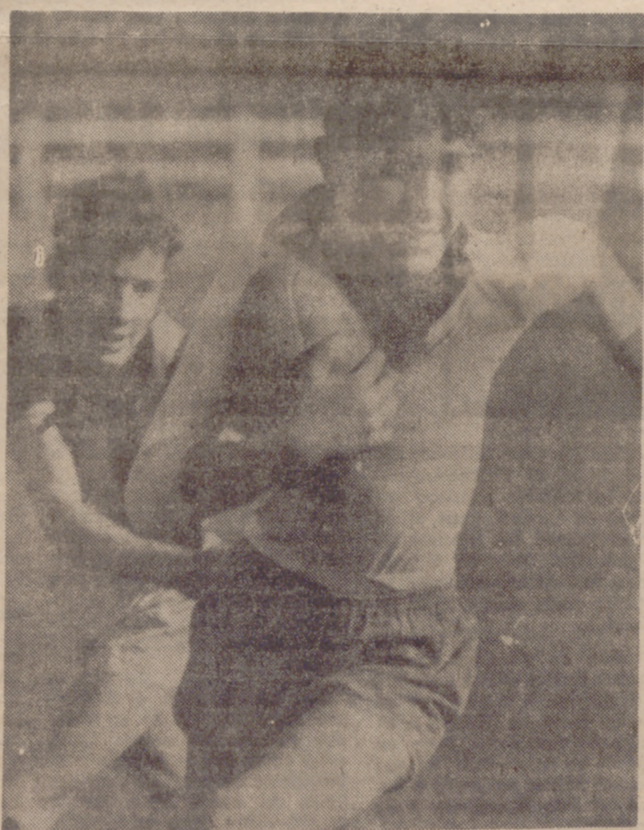
Esto es el rugby... Una definición que mañana se repetirá en la «Challenge Pepe Hurtado»

En total, treinta partidos y una noble, pero refinadísima batalla en bre todo, y al Centro Cultural. Y todos ellos para decidir el campeón en cada una de las categorías.