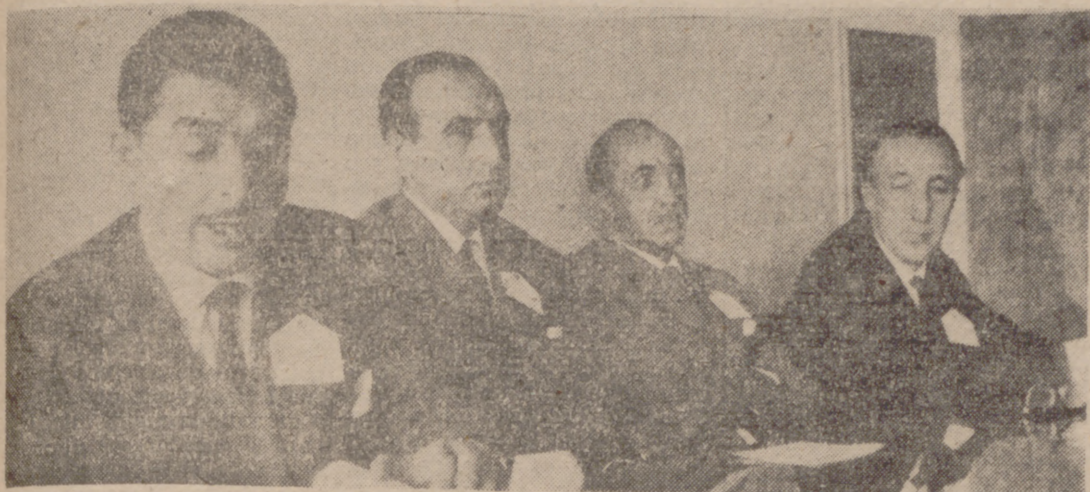
La presidencia de la Asamblea.