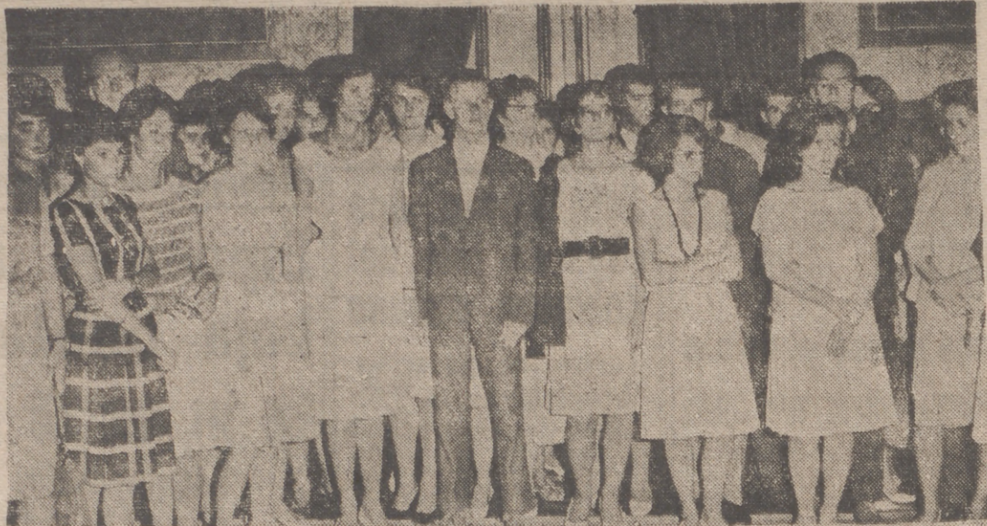
Los estudiantes de diversas nacionalidades, que componen el Curso para Extranjeros, en la recepción ofrecida por el Ayuntamiento.

Palabras de bienvenida del Alcalde y de gratitud del doctor Alarcos