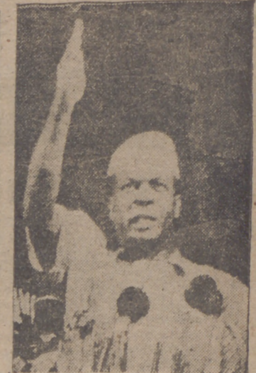
Deposito legal: V. N. 3 1958

VALLADOLID, viernes 3 de agosto de 1962 — Época V — Año XXXI — Número 7.424 — Precio: 1,50 pesetas