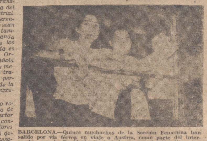
BARCELONA.—Quince muchachas de la Sección Femenina han salido por vía férrea en viaje a Austria, como parte del intercambio que la Regiduría Central de la organización tiene con otras organizaciones femeninas austriacas y de las cuales un número igual de muchachas se hallan en el Albergue de la Sección Femenina de Masnou.