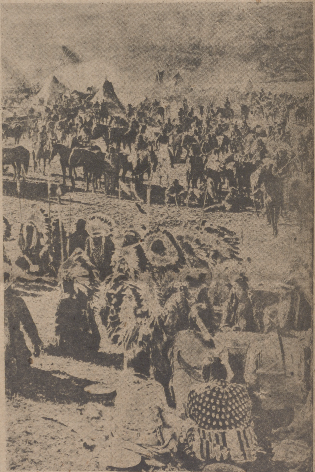
Los descendientes de los «pieles rojas» son hoy pobres y muchos sólo hablan los dialectos de sus tribus. Los americanos tratan de incrustarlos en la vida de la nación. Frecuentan las Universidades, y muchos «apaches» son ingenieros o electricistas.

gonquinos. Viven en «wigwags» circulares y son cazadores y pescadores, sobre todo de los enormes bancos de anguilas que periódicamente descienden por el San Lorenzo. Realizan un invento maravilloso, la canoa de corteza de abedul, con la que recorren enormes distancias. Al lado viven los iroqueses. No se puede pronunciar sin un temor ancestral el nombre de este ferocísimo pueblo, que no