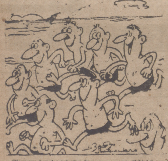
—Dicen que hay dos señoritas francesas con unos «bikinis» que...