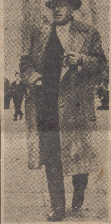
BARCELONA.—Fotografía del notable tenor Emilio Vendrell, que acaba de fallecer en esta capital.