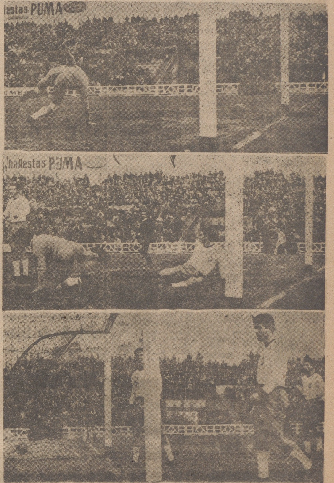
La delantera del Valladolid marcó tres goles y pudo haber conseguido más. Los suficientes para haber resultado la eliminatoria. En el grabado de Carvajal, los goles de Ramírez, Molina y Morollón, por el orden en que fueron conseguidos.