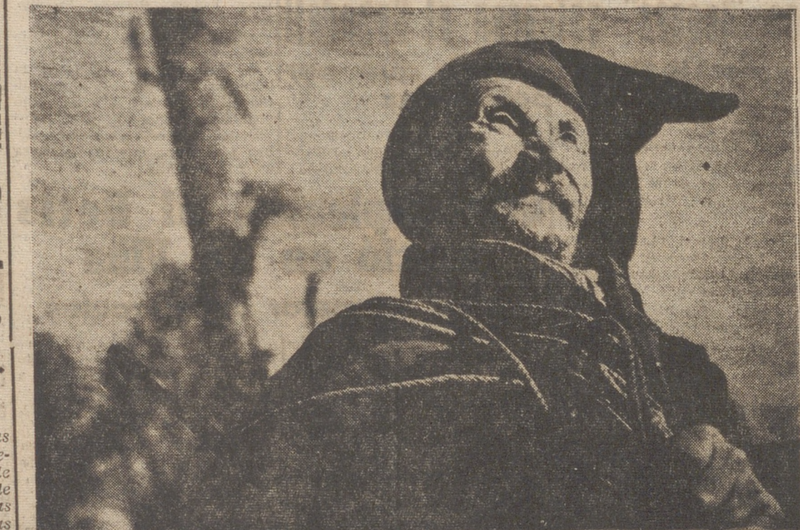
EL CONDUCTOR DEL "PORO RAITO".—Este viejo lapón es un experimentado conocedor de los desiertos helados. Con su viejo rifle a la espalda y la cuerda arrollada al cuerpo, viaja incansable sobre la nieve al frente de la caravana.

Lokka (Laponia).—(Del enviado especial de PYRESA).—En mis posteriores desplazamientos a los territorios del Círculo Polar pude llegar a los "tunturi" de Nattasi y Lokka, en donde habitan los Saamajainen (lapones) de más antiguas costumbres. Su dialecto, por otra parte, se ha visto influenciado por el finlandés y todavía existe el brujo o hechicero "noalde Kannus" o mago del tambor.