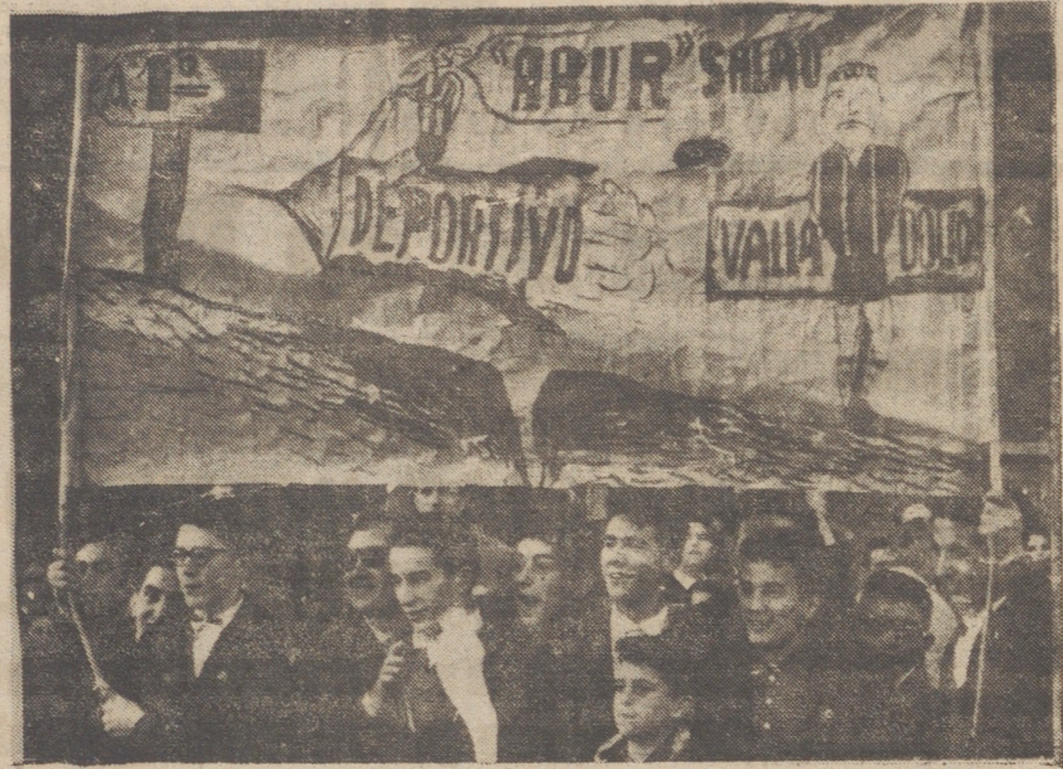
Otra de las pancartas con humor que se vieron en Riazor. Esperemos a ver si se cumple lo que aseguran estos aficionados coruñeses.

Hemos mencionado a la suerte, la mala suerte y esta vez, de verdad lectores, no es echar mano del tópico. Es intentar explicar lo ocurrido en Riazor, con arreglo a una estimación objetiva de cómo se produjeron los hechos.