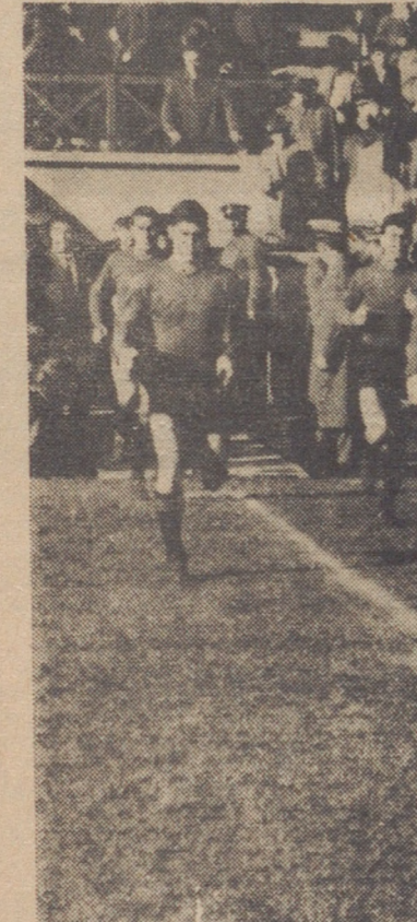
SALIO PRIMERO EL VALLADOLID. — La Federación Gallega hizo gestiones para que los equipos saliesen juntos al campo y evitar así, en parte, el recibimiento hostil al Valladolid. No accedió el Deportivo y aquí vemos a los jugadores blanquiverdes saliendo al campo, aguantando impávidos la monumental pita.

Como cualquier aficionado vallisoletano habíamos seguido la campaña del Deportivo paso a paso. Nos preocupaba la forma en que iba resolviendo sus encuentros y las aureolas de buen juego y potencia que se le rodeaba. Esto, en contraste con la vacilante marcha vallisoletana hacia que casi, casi, die-