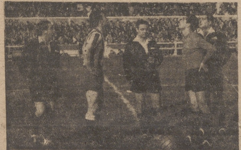
SALVO CRUZ.—García y Gorospe, capitanes de ambos equipos, miran las evoluciones de la moneda en el aire. Para el Real Valladolid salió cruz, pues no pudo tener peor suerte...

Pollo Intra Grill Asado al momento Unico establecimiento refrigerado Para su boda, banquete, fiesta Kostal Florido