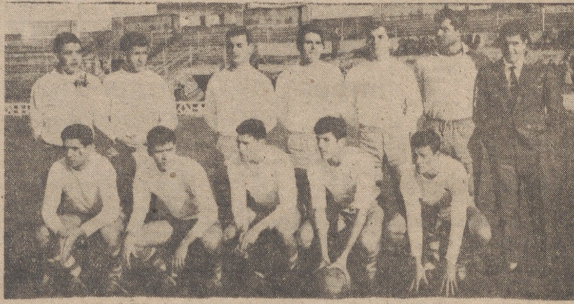
El conjunto berciano, con algunas bajas, fue derrotado en el Estadio por el Delicias.