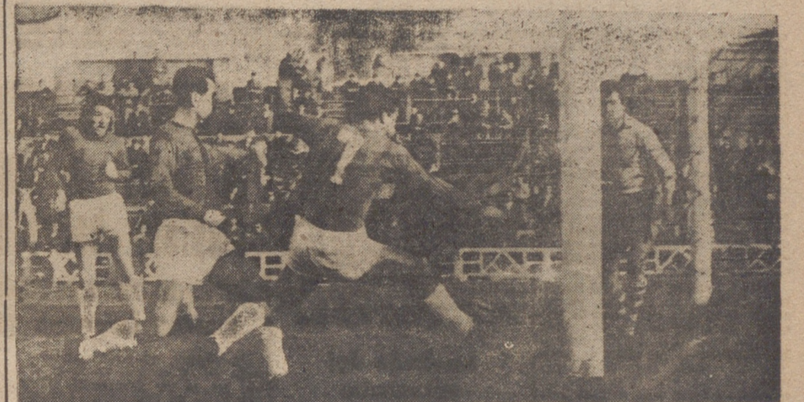
PRIMER GOL DEL EUROPA DELICIAS

La Ponferradina, con ausencias, practicó un sistema defensivo