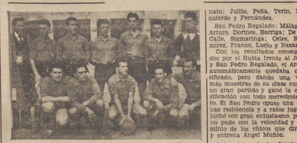
A. D. Ferroviaria, clasificada para la fase de ascenso a Tercera División.