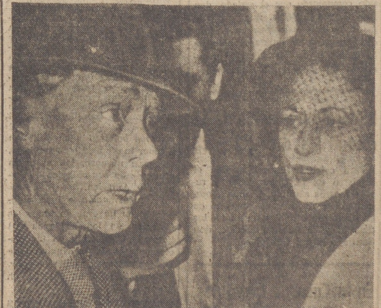
Invitados por los marqueses de Villaverde y el vizconde de Villamiranda, pasarán unos días de vacaciones en España, los duques de Windsor, a los que venimos en el momento de llegar a Madrid, procedentes de París, por vía férrea.

Madrid, 20. — El duque de Windsor ha estado esta mañana jugando una partida de golf en el Real Club de Puerto de Hierro. Después de dar varios paseos por el césped almorzó en dicho sitio, en compañía de su esposa y de varios amigos. Hasta noche cenarán los duques en casa de los vizcondes de Villaverde, y después de asistir a partidas de caza en los alrededores de Madrid marchará a Málaga, donde el duque participará en Guadalupe en los Campeonatos Internacionales de Golf de la Costa del Sol. Después de una breve estancia en Granada regresará a Madrid. — Cifra.