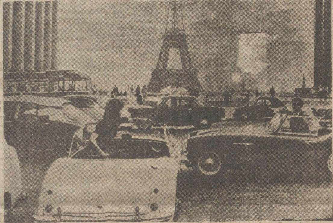
Un millón de coches en París

viendas como las fabricas se hallan repartidas por todas las partes. No ocurre lo mismo con los comercios, los centros bancarios, oficinas, teatros, escuelas de enseñanza superior, etc., que se concentran en el interior de la ciudad. Esto da ocasión a un enorme movimiento, a un constante ir y venir de la ciudad para fuera e inversa. Una quinta parte de todos los habitantes del gran París necesita más de dos horas al día para recorrer el camino hasta su centro de trabajo. A pesar de la magnífica organización y de la rapidez del tráfico los medios de locomoción no son suficientes para transportar a esta gran población. Es valiosísimo el servicio que presta el "Metro". Sólo la estación de San Lázaro, que tiene un recorrido circular de 45 kilómetros, y que comunica los sectores norte y oeste, transporta en ambas direcciones a 350.000 viajeros.