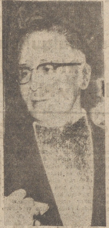
Don Rafael Bonnelly ha sido nombrado nuevo Presidente de la República Dominicana.