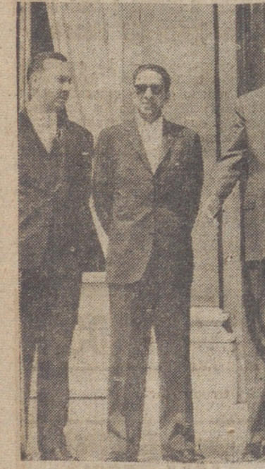
Los Reyes de Nepal, durante una visita a De Gaulle

recientemente del sherpas, Tensing, conquistador con Hillary del Everest. A causa del accidentado relieve de su país, los habitantes, aunque unidos por un común sentimiento de la patria, han llegado a distinguirse físicamente, constituyendo más diez grupos étnicos. El valle más fértil y poblado es el de Kerm. En él, donde están las tres principales ciudades, a poca distancia entre sí. Fueron fundadas antes de Jesucristo por los Newars, de origen desconocido, pero creadores de la civilización nepalí. La capital, y principal de estas ciudades es Katmandu, de unos 120.000 habitantes, fundada en la forma de la espada de la diosa Devi. Las otras son Patan, la más antigua, creada por el emperador Asoka, en la forma de la rueda de la ley budista, y Bhaktgan, en la forma del tambor del dios Mahaga. La religión es una mezcla de budismo y de hinduismo, y predomina el sistema de castas, aunque no con tanto rigor como en la India. Los Newars también introdujeron el cultivo del arroz e hicieron grandes obras de irrigación, que todavía son la base de la economía nepalí.