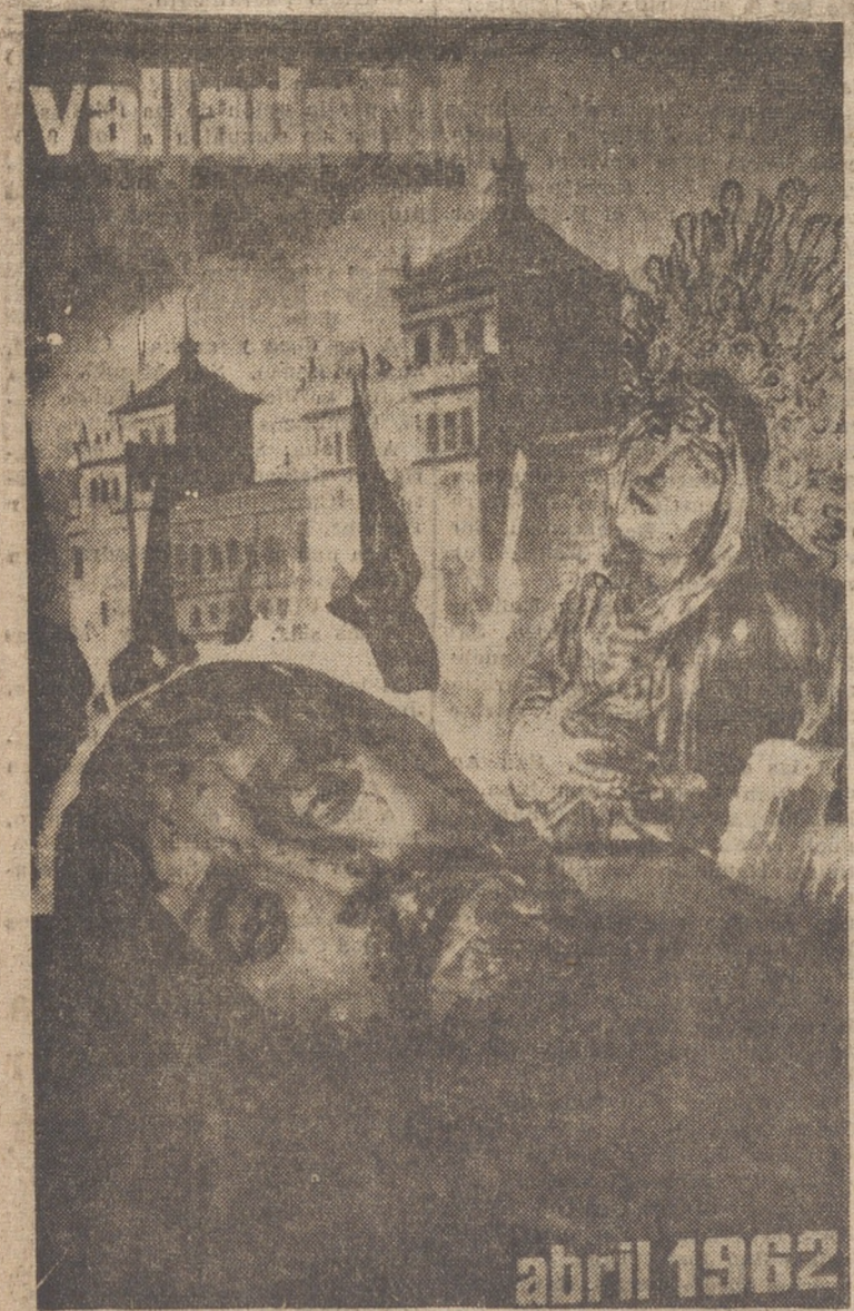
Este es el cartel publicitario de la Semana Santa Vallisoletana, que ha sido profusamente difundido por el extranjero y varias ciudades españolas. Su autor es nuestro estimado compañero en la prensa, José del Río Sanz.