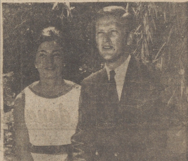
Hoy se celebra en Xevy (Suiza) la ceremonia de la boda a los efectos civiles de S. M. Simeón II, rey de los búlgaros, con doña Margarita Gómez Acebo y Cejuela. El solemne acto será seguido de una función religiosa en la que se entonará un Te Deum de acción de gracias. El matrimonio de S. M. se había contraído canónicamente en Madrid, después de haber obtenido las necesarias dispensas de la autoridad eclesiástica.