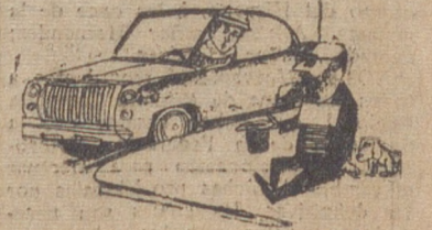
No llegas tarde: hoy tenemos invitados.

Dicen que el primer accidente automovilístico ocurrió en Paisley, ciudad próxima a Glasgow, el 29 de julio de 1834. La rotura de una rueda en un diligencia automovil a vapor, a consecuencia del exceso de pasajeros, hizo volcar el vehículo y estallar la caldera. Murieron cinco viajeros y ello fue causa del atraso inicial del desarrollo del automovilismo en Inglaterra.