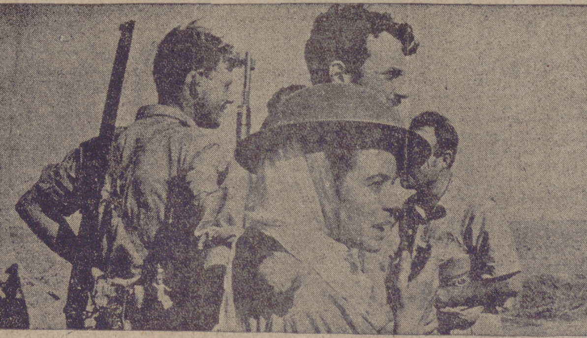
Las mujeres se movilizaron también en Egipto para luchar contra las fuerzas invasoras. Aquí vemos a una de ellas que forma con una patrulla de francotiradores observando atenta los movimientos de las fuerzas inglesas cerca de la costa.