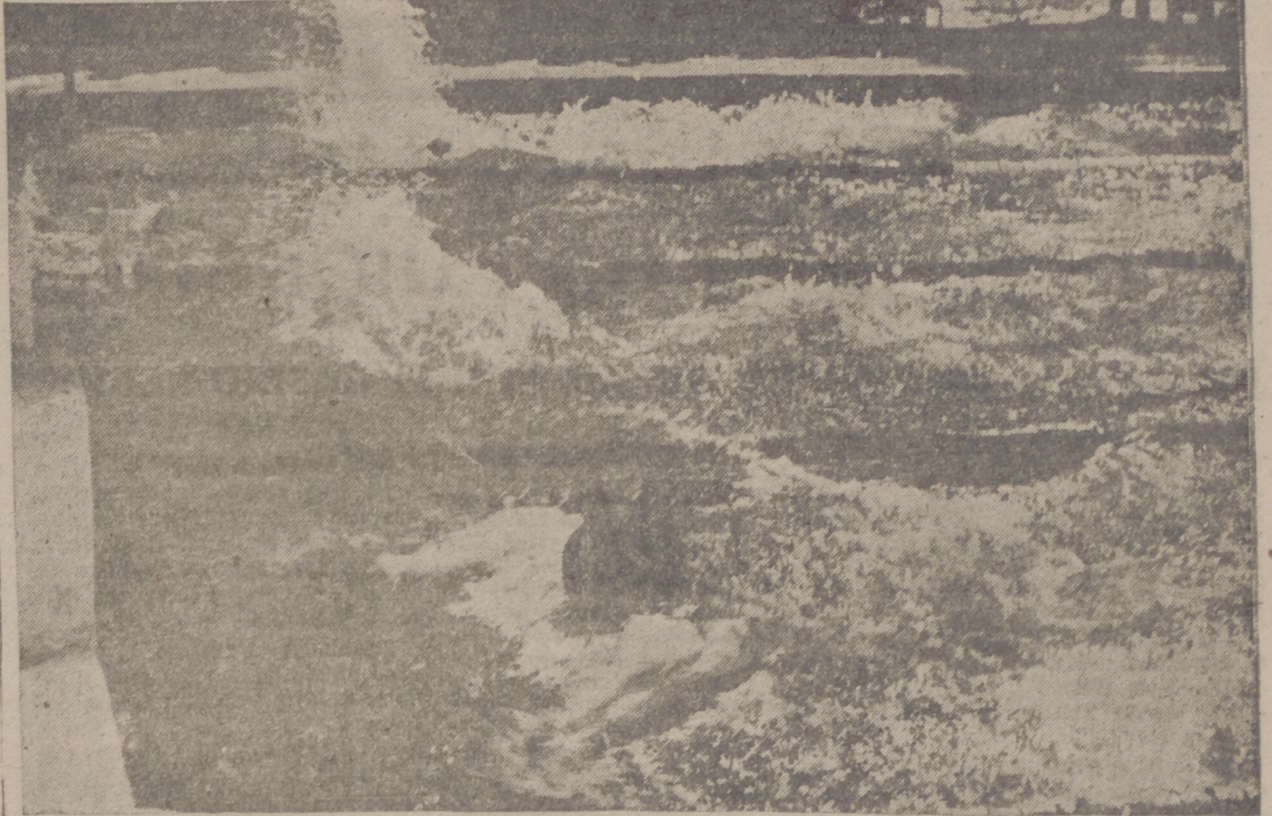
Un momento de la prueba de cien metros braza.