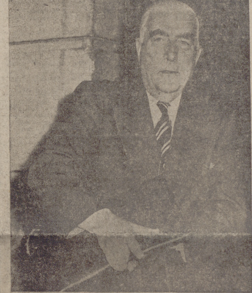
Mister Menzies, con la famosa cartera del Plan Dulles, presentado ayer a Nasser.