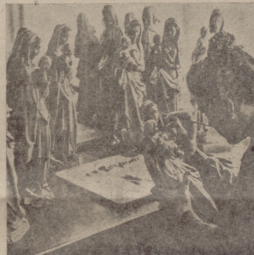
Esta artesana da los últimos toques a una serie de imágenes de la Virgen. En ello pone todo el amor de esta magnífica tradición imaginera.