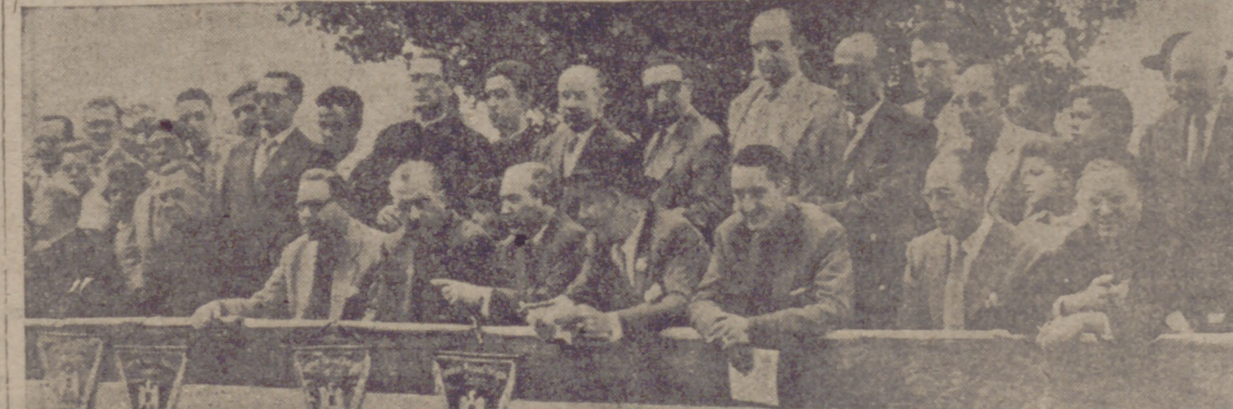
Algunos de los participantes en la clausura de los Campeonatos, en la que figuran, con el delegado nacional del Frente de Juventudes, las primeras autoridades vallisoletanas.