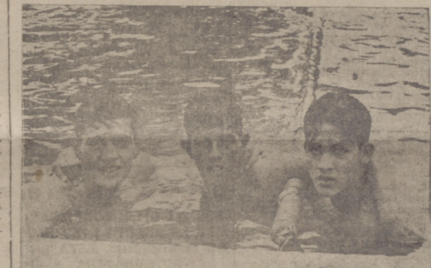
Un grupo de nadadores de cien metros libres.

Los resultados fueron: Murcia, 9; Orense, 5. Gerona, 5; Santander, 2. Cuenca, 4; Badajoz, 2. Guipúzcoa, 4; Tetuán, 3. Clasificación general: Campeón, Murcia, seguido de Orense, Gerona, Santander, Cuenca, Badajoz, Guipúzcoa y Tetuán.