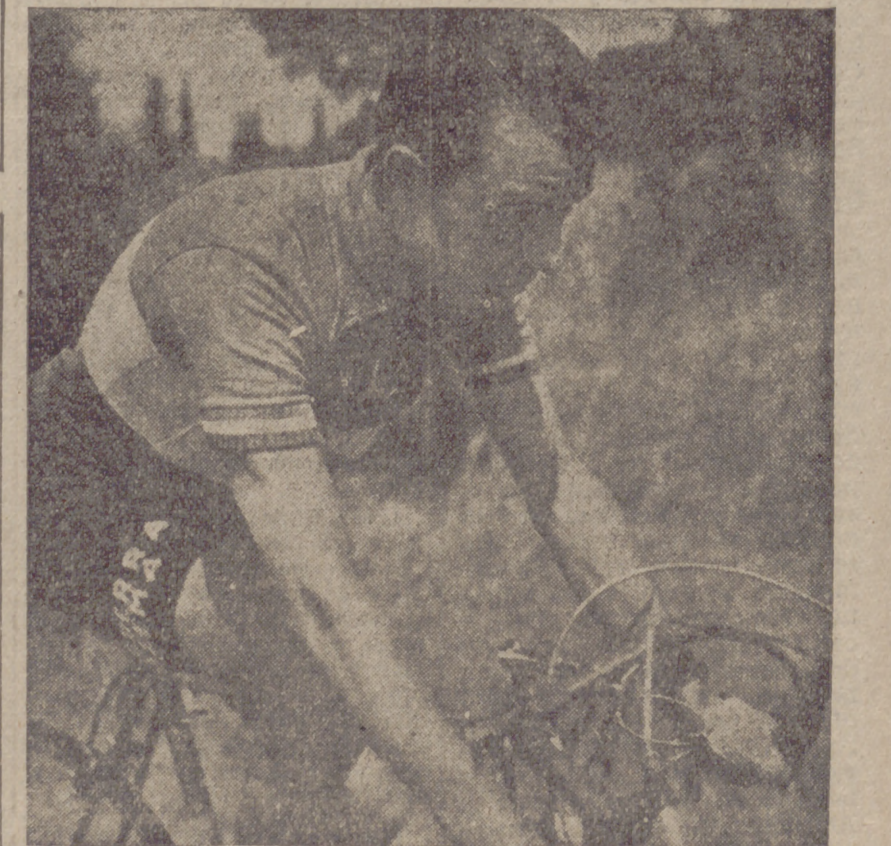
GAUL, vencedor de la etapa de ayer.