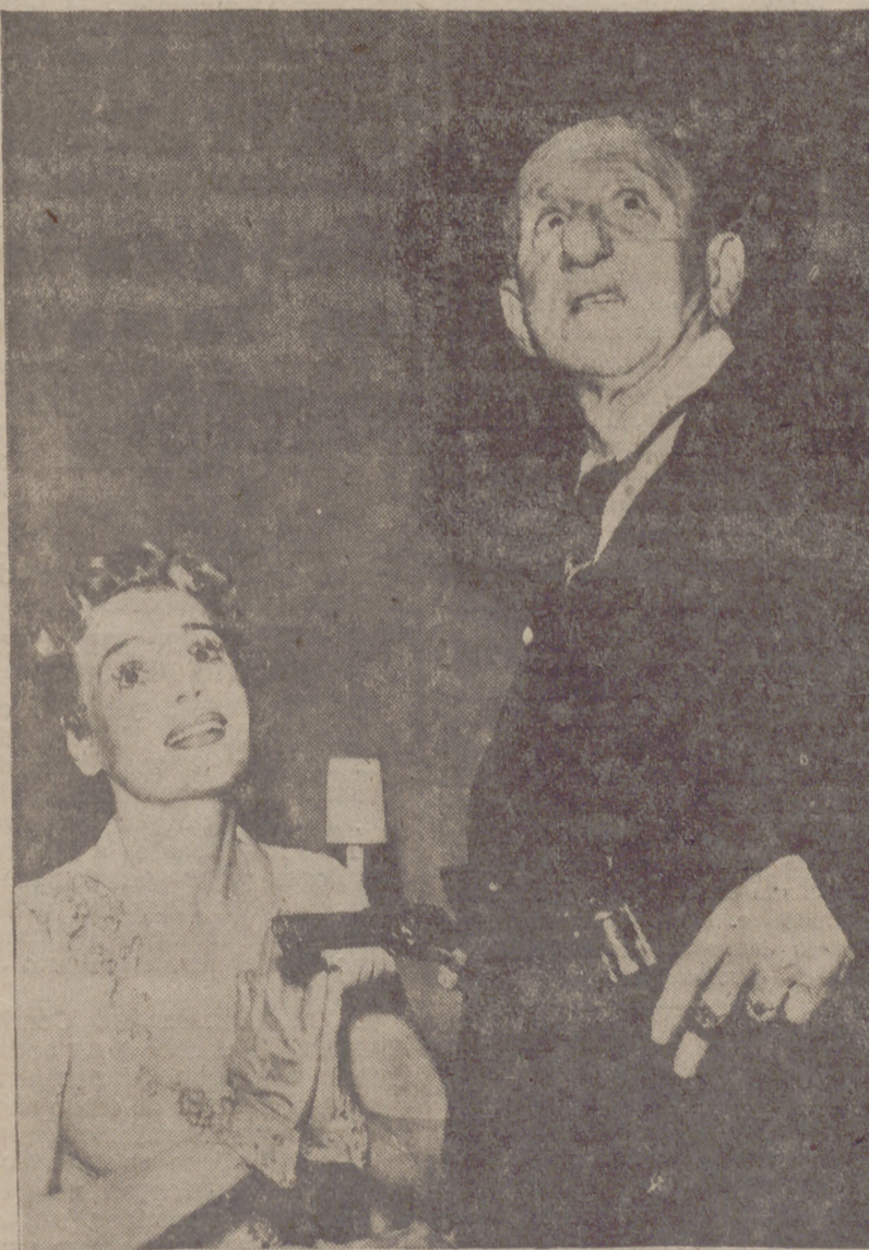
Jimmy Durante y Marie Wilson, agotados por el trabajo durante el rodaje de una escena en Hollywood, piden una tregua al director del film. Es realmente consolador que las repeticiones no se vean luego desde la butaca del espectador.