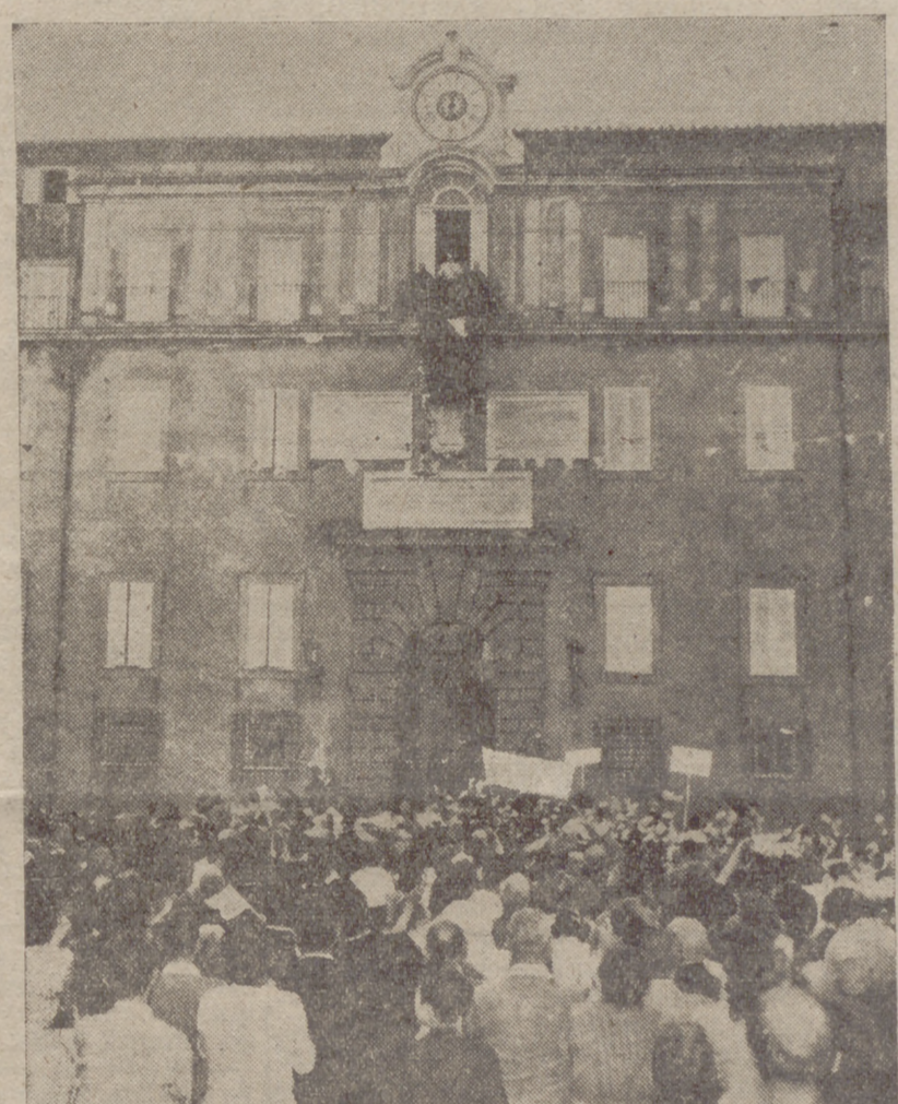
El Papa, que pasa la temporada veraniega en Castelgandolfo, aunque sin disminuir su intensa jornada de trabajo, bendice a la multitud que le esperaba ante la residencia estival.