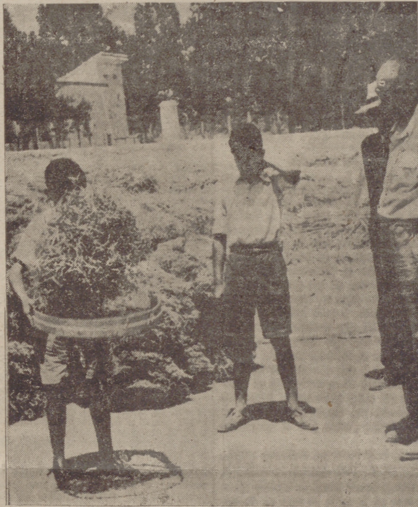
Huerca-Overa (Almería).—Un aspecto de las faenas prácticas de trilla del trigo y cebada por los alumnos del Instituto Laboral de esta localidad, en el campo de experimentación de dicho Centro.