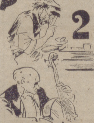
¿COMO ESTAN TUS TEMAS?

Solución al último jerooglífico: LA LANA LA LAVA MAS