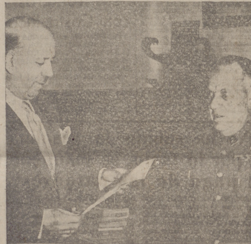
Los momentos en que el alcalde entrega los escritos de agradecimiento al coronel jefe de la Guardia Civil y al comandante jefe de la Policía Armada.