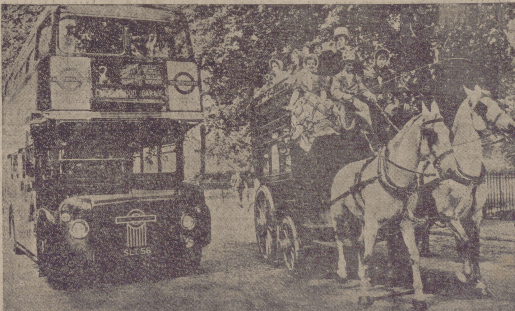
Para conmemorar el centenario del autobús, la capital de Inglaterra ha organizado un festival en el que participaron vehículos de las sucesivas etapas. En la fotografía se ha recogido el del último coche puesto en servicio en este año de gracia. Como puede verse, los pasajeros van ataviados con arreglo a la época.