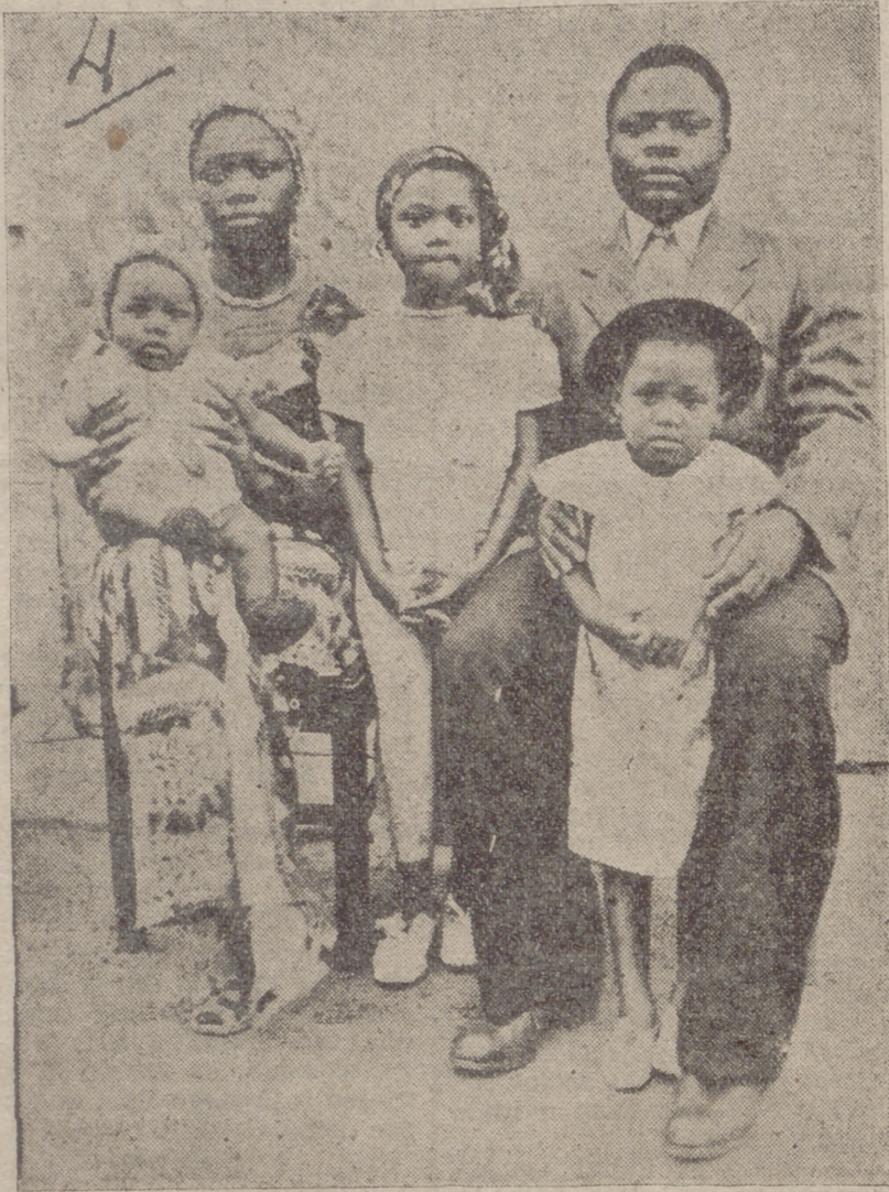
Familia bantu, del Congo Belga. El marido es empleado principal del ferrocarril en Elisabethville.

—Poseen una formación muy completa en todos los aspectos, sobre todo en lo que se refiere a edu-