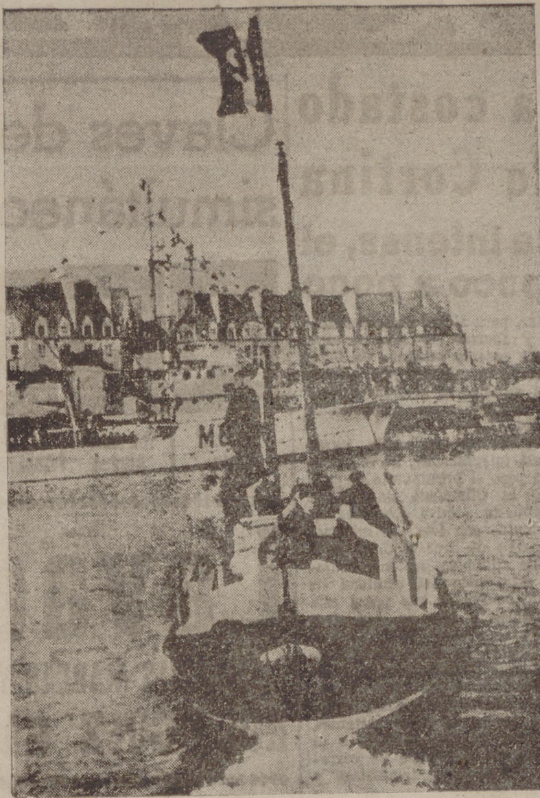
El cardenal Roques presidió los tradicionales actos que anualmente se celebran en el puerto de Saint Malo y en los que se despiden a la flota que marcha hacia los bancos de Terranova para la pesca de la ballena.