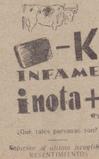
Solución al último jerooglífico: RESENTIMIENTO