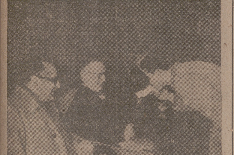
Un momento del acto.

Ayer, a las once, se celebró en los Talleres Generales de la Renfe la entrega de credenciales a los alumnos de la 7.ª Promoción de la Escuela de Aprendices de dichos talleres.