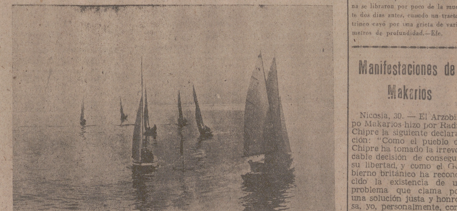
Santander.—Por primera vez en Santander se ha celebrado una regata de Snipes en Navidad. La regata ha sido organizada por el diario «Alerta» y ha constituido un gran éxito.—(Foto Samot.)