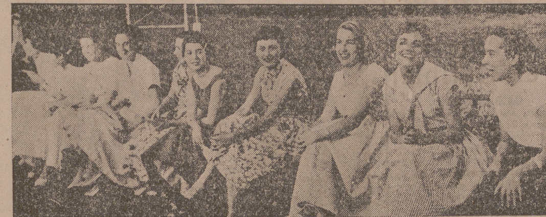
Grupo de señoritas participantes en la gymkhana.

Ayer, como fin de curso, se celebró en las pistas de la Real Sociedad Hipica una prueba de obstáculos, en la que tomaron parte los rucos alféreces del Arma. La lista de concursantes fue la siguiente: