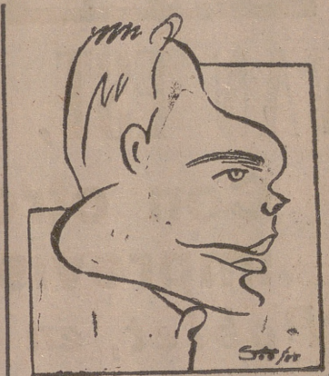
"SICKI", visto por Soto

donde actué ante 16.000 personas que me aplaudieron con fervor indescribible. Los mayores aplausos de España los recogí la noche del lunes, aquí en Valladolid, en que el público me estuvo aplaudiendo durante casi cinco minutos. —¿Ha actuado ante alguna personalidad de categoría mundial? —En Dinamarca, hace más de seis años, ante el general Eisenhower, y después en Londres, ante la princesa Margarita. Terminamos nuestra charla con este joven alemán, que nos dice al despedirnos que, aunque no es nada nervioso, sin embargo le molestan las cosas que salgan de lo normal en un circo. En una ocasión se le precisó a impedir a un señor que tomase su actuación con cámara tomavistas y no porque temiera que le copiasen los números, que es labor de voluntad casi únicamente. N. GONZALEZ VIANA