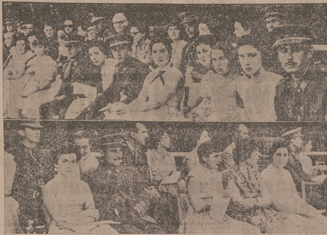
Dos grupos de asistentes a las interesantes pruebas.