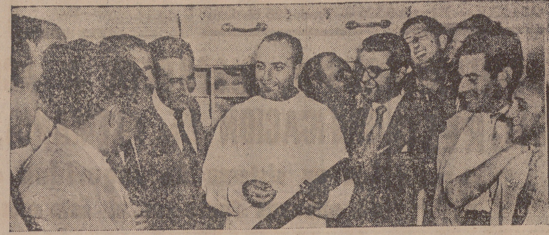
En la Granja-Escuela "José Antonio" de la Diputación se celebra un curso de inseminación artificial, y en el transcurso de la conferencia que tuvo lugar ayer, nuestro redactor gráfico obtuvo la foto que figura en este gráfico.