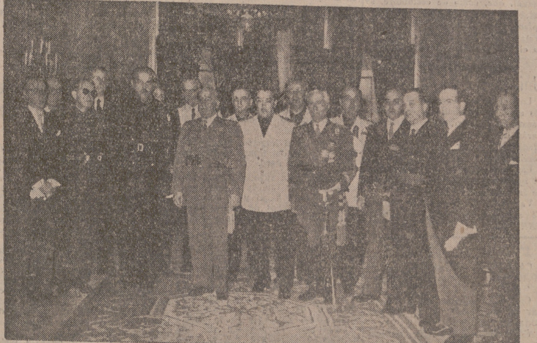
S. E. el Jefe del Estado, Generalísimo Franco, recibe al Consejo Nacional de la Vivienda, presidido por el ministro de Trabajo, camarada Girón.