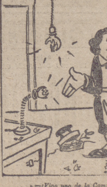
—¡Vino uno de la Compañía y lo dejó así...!