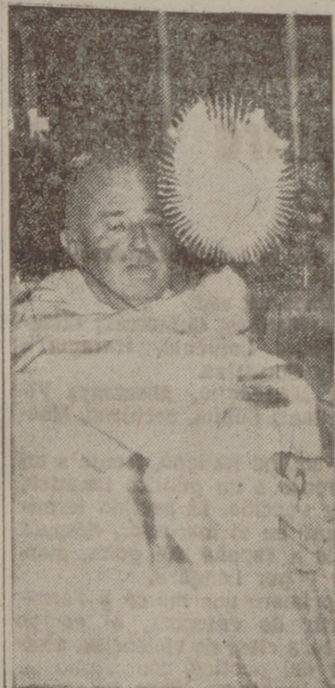
Nuestro reverendísimo Prelado dando la bendición con el Santísimo.

Desde las primeras horas de la mañana aparecieron las calles de la ciudad engalanadas en muchas de sus casas con los colores de la bandera nacional.