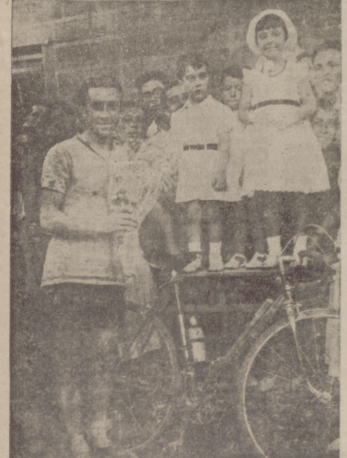
El ganador de la carrera