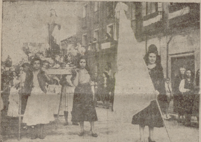
Con motivo de la festividad de San Juan Bautista, en la tarde de ayer recorrió las calles del populoso barrio de San Juan una fervorosa y tradicional procesión.