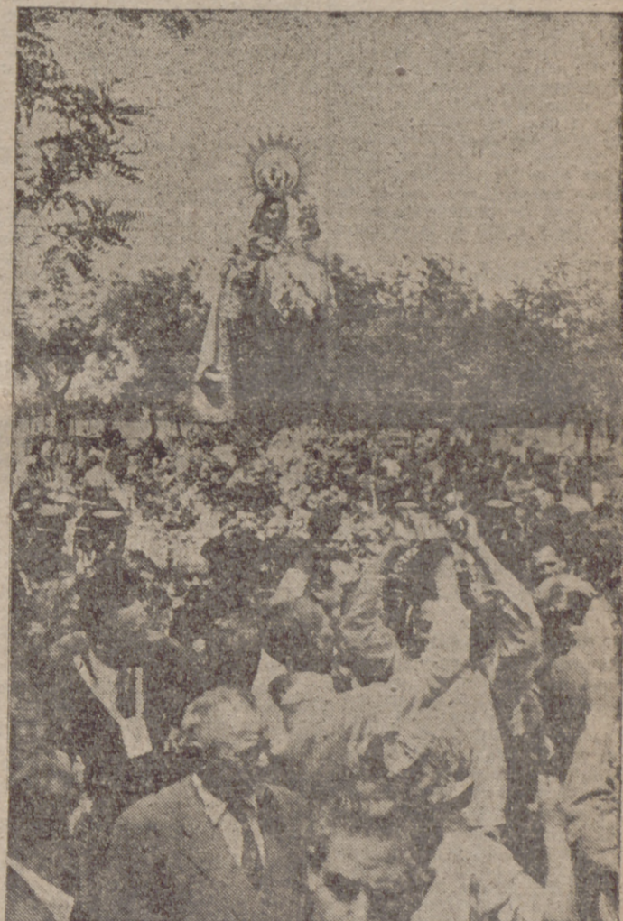
La imagen de Nuestra Señora del Carmen durante la procesion celebrada en la Pradera de Extramuros.