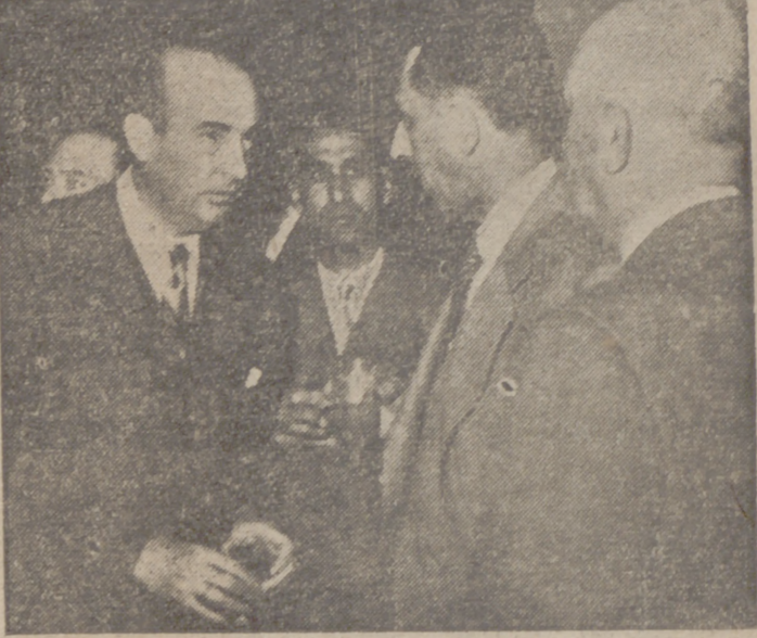
MADRID.—El ministro de Comercio, en presencia del director general de Prensa, recibe a la Prensa extranjera, a la que hizo importantes declaraciones sobre su viaje a Estados Unidos y la situación comercial española.