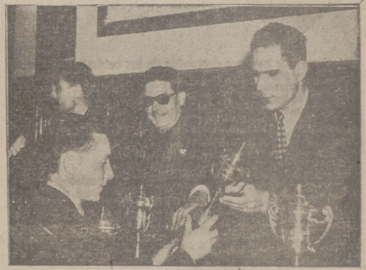
Un momento del reparto de premios.

Ayer se celebró en el Salón de Actos de la Escuela de Comercio el reparto de los premios otorgados en el primer Concurso convocado recientemente por la Asociación Castellano-Leonesa de Taquígrafia.