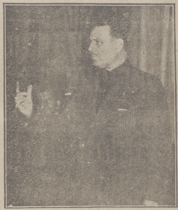
El jefe provincial hablando en Peñafiel de Hornija.