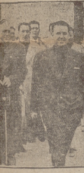
Jefe provincial con el jefe local de Wamba a su entrada en el pueblo.