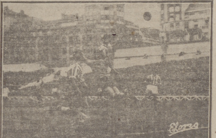
EL PRIMER GOL DEL VALLADOLID