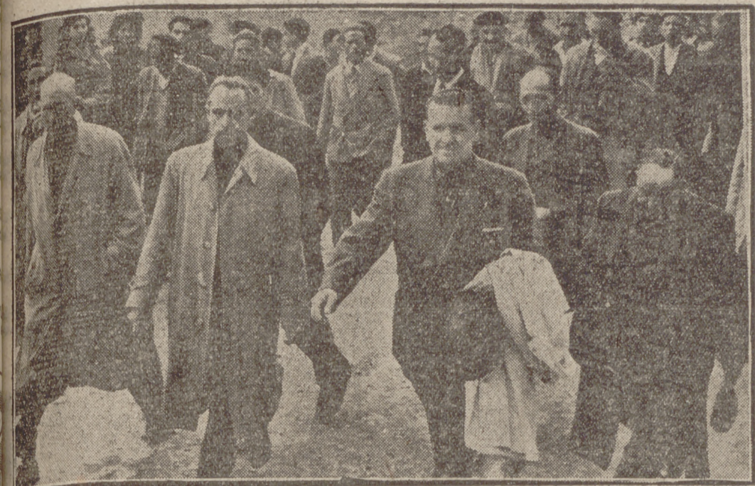
El jefe provincial y gobernador civil al llegar a Cabezón.