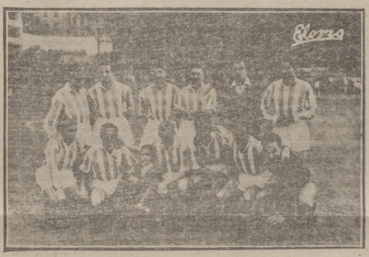
Equipo que ostentó el Valladolid en San Mamés.