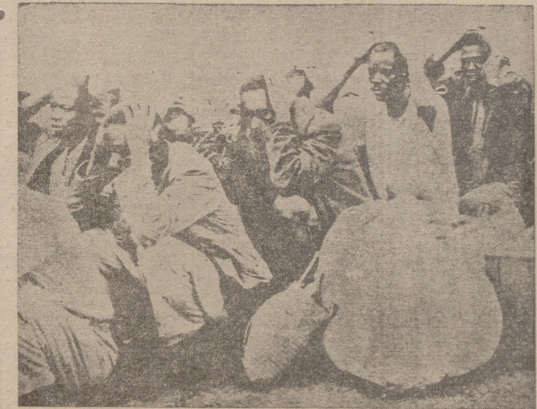
Estos "socios" del Mau Mau son parte ínfima de un numeroso grupo detenido por las fuerzas inglesas. Con las manos a la cabeza —así colocadas por el apunte de los fusiles-amertralladores—, parece que piensan en la que les espera. ¡Y no les falta razón para pensar así!

Desfile militar ante el Jefe del Estado con armamento yanqui San Pedro de Macoris, 1.—En Belgrado, la celebración del primero de mayo ha tenido el solemne carácter militar que tiene en todos los países comunistas. El dictador rojo, Tito, ostentando uniforme de mariscal, presidió el desfile de su Ejército, que ostentaba nuevo uniforme y tanques y armas enviados por América. No hubo, desde luego, ninguna manifestación obrera.