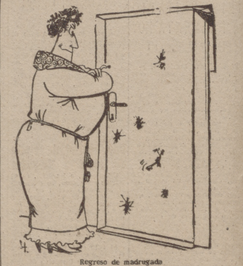
Regreso de madrugada