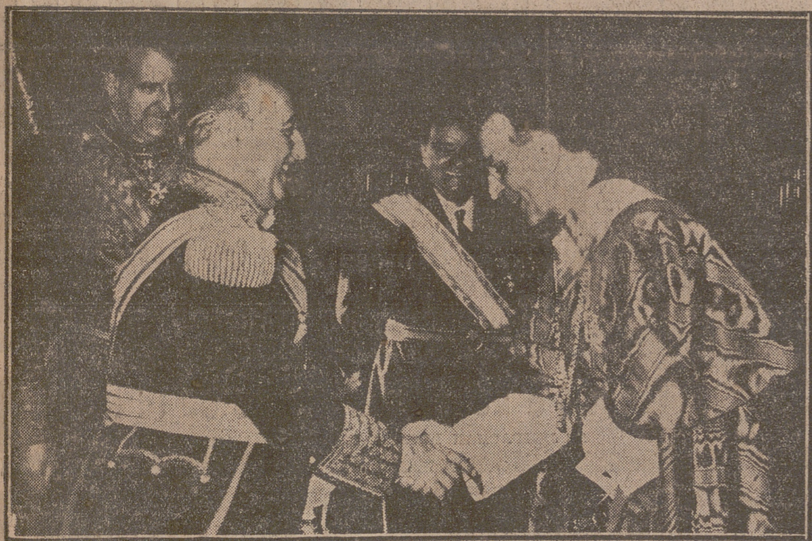
Ante Su Excelencia el Jefe del Estado, presentó sus cartas credenciales el Nuncio de Su Santidad, monseñor Antoniutti. El Caudillo y el Nuncio conversaron tras de la ceremonia en presencia del ministro de Asuntos Exteriores.