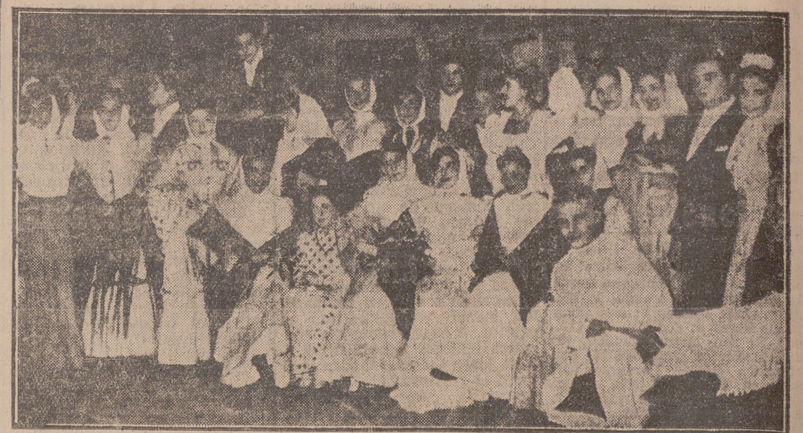
Los magníficos intérpretes de "La verbena de la Paloma"

La realidad ha correspondido a la expectativa que había respecto de la extraordinaria función que en el Teatro Calderón tuvo lugar anoche, organizada por la Obra Social del Movimiento y patrocinada por el Excmo. señor gobernador civil y jefe provincial, para la Campaña de Navidad.