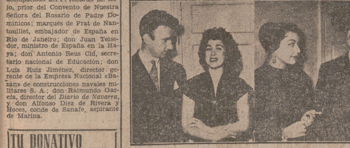
Con enorme éxito se celebró ayer en Calderón el anunciado festival a beneficio de la Campaña de Navidad, de la Obra Social de la Falange, en el cual se puso “La Verbena de la Paloma” por un aplaudidísimo grupo de intérpretes, tomando parte en el mismo famosas figuras de nuestro cine. En esta foto aparecen Fernán Gómez, Aurora Bautista, Ana Esmeralda, Cesáreo González y Marisa de Lesa, cuya presencia realizó el éxito de la magnífica velada. (En páginas interiores, amplia reseña de este acto.)

TU DONATIVO a la CAMPANA DE NAVIDAD se traducirá en alegría y calor hogareños