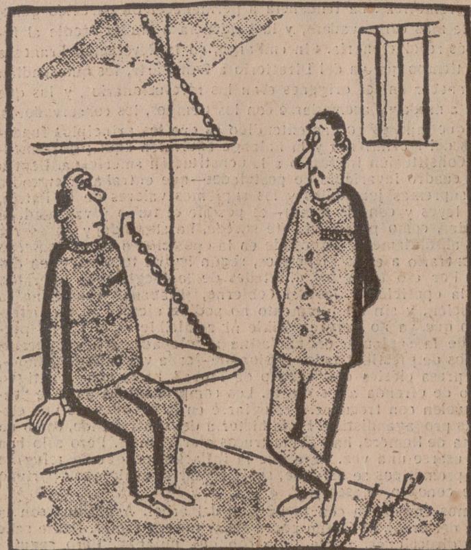
—Yo le voy a decir por qué el gobernador de la prisión no ha concedido la gracia... ¡El gobernador soy yo!