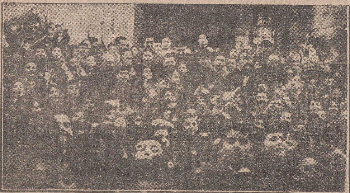
Nuestro Prelado, rodeado de niños a la salida de la Catedral.

El señor Arzobispo les habló ayer en la Catedral